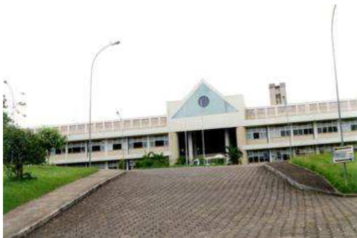
Ilustração 01 - IFES- Campus Colatina

Situado no Bairro Santa Margarida, o IFES Campus Colatina é uma escola bem conservada, limpa, espaçosa, arejada, com corredores amplos, tornando o ambiente bastante agradável. É um prédio de dois pavimentos, com sacadas de onde podemos deleitar-nos com a bela paisagem do rio Doce.