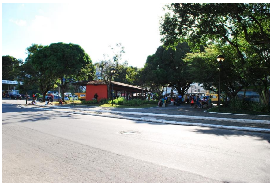
Figura 10 – Praça dos Eucaliptos, Bairro Maruipe, Vitória/ES