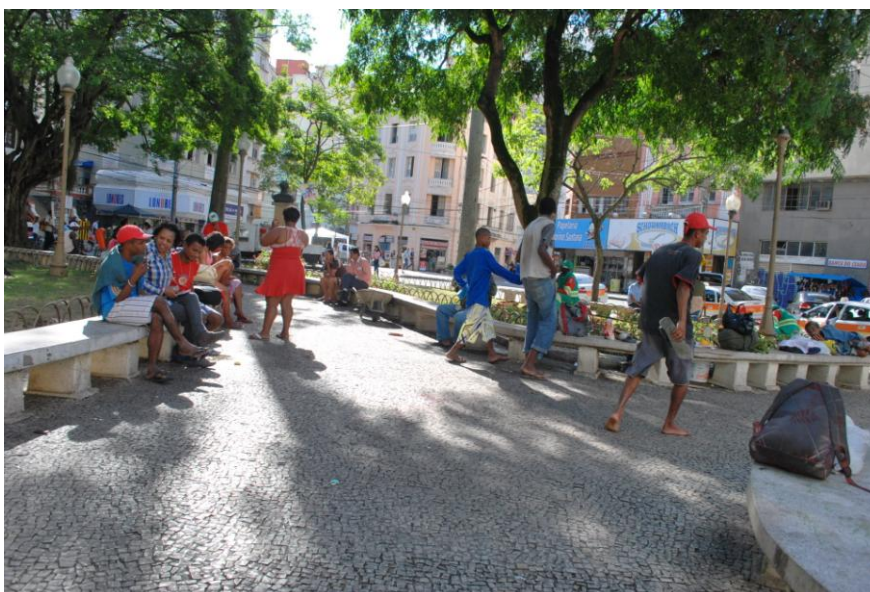
Figura 1 – Praça Costa Pereira, Centro da Cidade de Vitória/ES

Esta praça é um espaço de grande circulação de pessoas, anunciada em sites de turismo como sendo o “coração da cidade” de Vitória. Na praça, encontravam-se não só adultos como também adolescentes em situação de rua, no entanto a população adulta masculina estava em maior número. Dividindo o espaço da praça havia trabalhadores desempregados, pessoas em busca de profissionais do sexo, pastores evangélicos em suas pregações, indivíduos que fazem da praça espaço para compra e/ou venda de drogas, além da ostensiva presença da Polícia