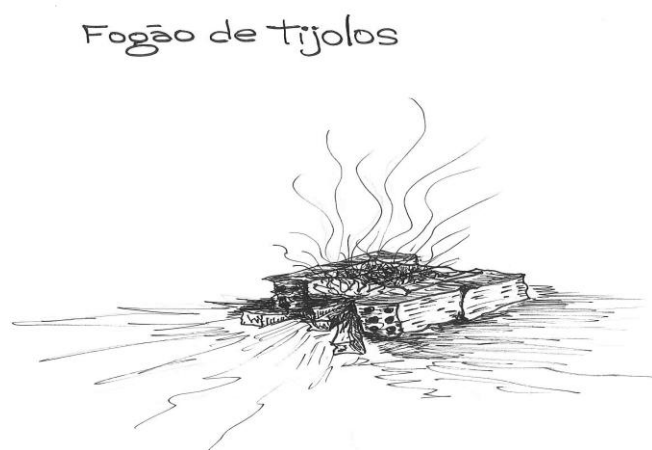
Figura 15 – Fogão de tijolos desenhado pelo professor Gilberto Kunz

O fogo pode também ser alimentado por lenha ou carvão. Latas menores de conservas são utilizadas como panelas. Outros elementos encontrados nas ruas podem facilmente servir para serem transformados em “fogão a lenha”. Restos de construções, como tijolos e paralelepípedos, são ajustados de forma que possam acomodar uma grelha (Figura 15). Por vezes um muro qualquer também compõe a fabricação do “fogão a lenha”, pois o muro ajuda a proteger o fogo do vento.