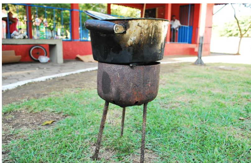
Figura 16 – Fogareiro artesanal encontrado na Praça dos Eucaliptos, Maruípe, Vitória/ES

Havia um diferencial na invenção do fogareiro do grupo de rua da Praça dos Eucaliptos em Maruípe. Era uma produção de forma artesanal que possivelmente contou com os serviços de serralheria. O fogão produzido era de ferro com forma abaulada: corte, furação e solda de metal foram utilizados em sua montagem (Figura 16). Além disso, três vergalhões de ferro faziam a sua sustentação, servindo como pés do objeto e sobre a única “boca” havia uma grelha. O fogão artesanal comporta dois litros de álcool destilado e com o resultado dessa produção é possível cozinhar diversos tipos de alimentos como moqueca de peixe, arroz, polenta e sopa de legumes, conforme informação do grupo que habitava a Praça dos Eucaliptos.