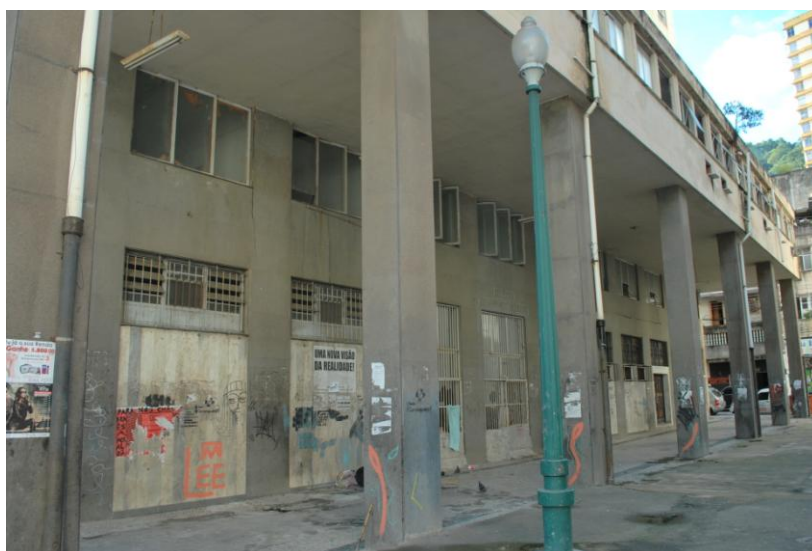
Figura 4 - Marquise do IAPI, Centro da Cidade de Vitória/ES

Essa construção possui 12 andares, as janelas estão quebradas e as paredes pichadas. É o verdadeiro retrato do abandono e está desativado desde 1999, quando era utilizado pelo Ministério da Saúde que desde então devolveu o edifício para o Patrimônio da União. São recorrentes as queixas de toda a comunidade local, principalmente dos comerciantes, pelo abandono do prédio e a forma como ele vem sendo ocupado por moradores de rua. O IAPI está desativado aguardando sua incorporação ao projeto “Morar no Centro”, para que seja reformado e transformado em moradia com apartamentos populares. 11