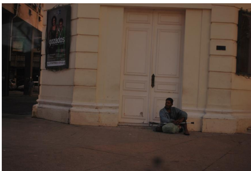
Figura 2 – Teatro Carlos Gomes, Centro da Cidade de Vitória/ES

No entorno da praça existem diversos estabelecimentos comerciais que lidam com vendas de celulares, roupas, calçados, relógios, além de restaurantes, lanchonetes, pastelaria, um pequeno mercado de varejo e um teatro municipal – o centenário Teatro Carlos Gomes (Figura 2) –, uma repartição pública da Escelsa e outros. Transitam também por ali trabalhadores autônomos e barraqueiros que vendem mercadorias diversas desde alimentos, CDs piratas, bijuterias, a doces e roupas artesanais.