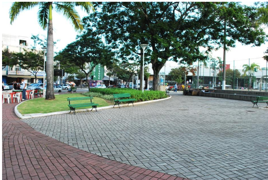
Figura 7 – Praça do Bairro Jardim da Penha, Vitória/ES

A Praça mantém nos finais de semana uma movimentada feirinha de artesanato e alimentação no início da noite. Point da galera jovem de classe média, a praça é constante alvo de repressão policial no intuito de conter a formação de grupos de moradores de rua, entre eles os guardadores de carros nas vias públicas, figuras fáceis por ali. No Jardim da Penha já foram protagonizadas muitas violações de direitos em função de ações repressoras e truculentas por parte de agentes da segurança pública contra moradores de rua.