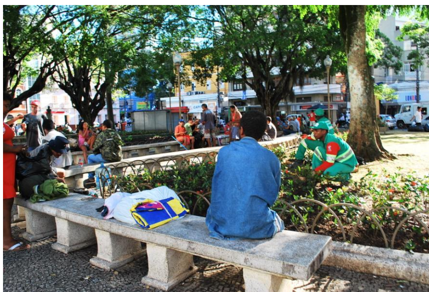
Figura 6 – Praça Costa Pereira, Centro da Cidade de Vitória/ES

Mas houve um imenso silêncio sobre o ocorrido. Nem uma nota na mídia, nem uma manifestação do sistema de garantia de direitos ou das políticas públicas que atuam na atenção à população de rua. A marquise do IAPI foi literalmente lavada, não havia vestígios dos moradores. Na parede do prédio permanecia a inscrição em negrito: “Tua fome é de que?” Buscamos informações sobre as 49 pessoas que ocupavam a praça, mas ninguém sabia para onde tinha ido a turma e apenas diziam que o pessoal tinha se dispersado. Continuamos na espreita, acompanhando os diversos movimentos que se produzem a partir de então.