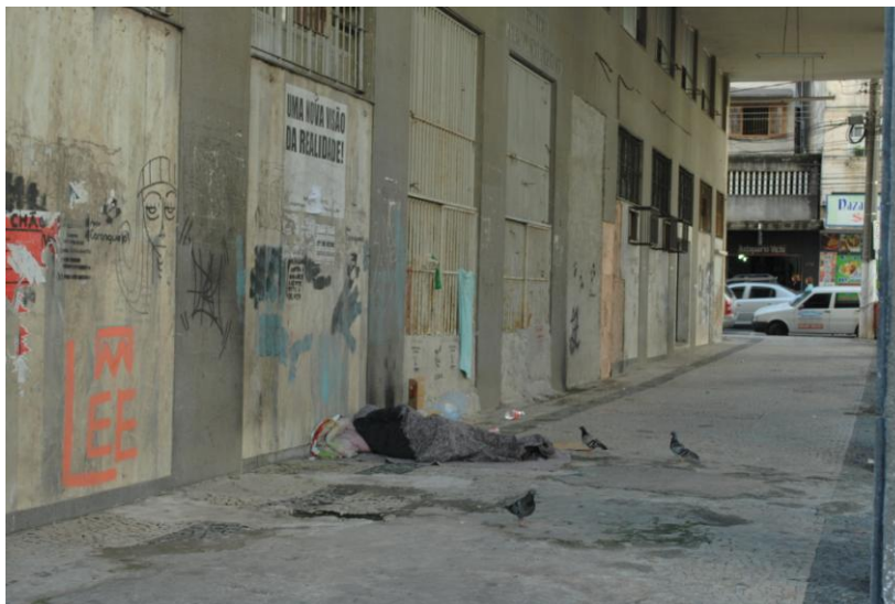
Figura 3 – Marquise do IAPI, Centro da Cidade de Vitória/ES

Essa construção possui 12 andares, as janelas estão quebradas e as paredes pichadas. É o verdadeiro retrato do abandono e está desativado desde 1999, quando era utilizado pelo Ministério da Saúde que desde então devolveu o edifício para o Patrimônio da União. São recorrentes as queixas de toda a comunidade local, principalmente dos comerciantes, pelo abandono do prédio e a forma como ele vem sendo ocupado por moradores de rua. O IAPI está desativado aguardando sua incorporação ao projeto “Morar no Centro”, para que seja reformado e transformado em moradia com apartamentos populares. 11