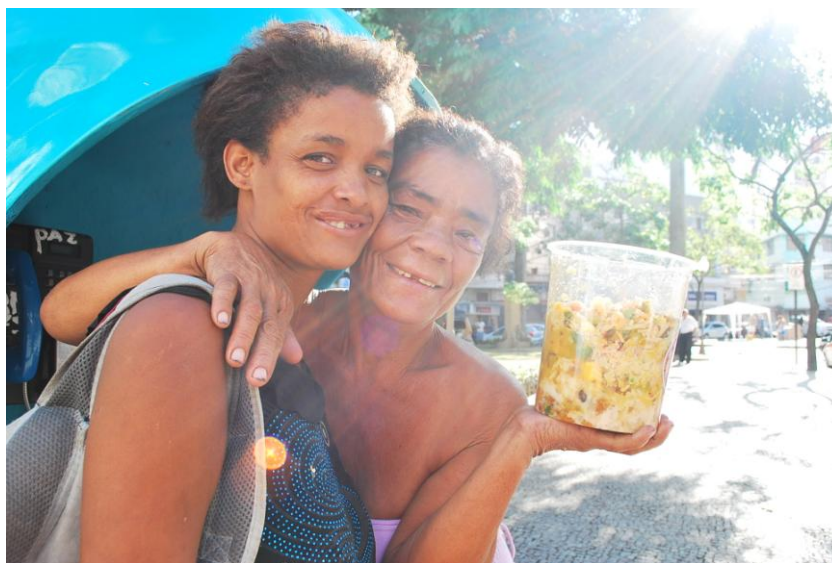
Figura 13 – Alimento doado por restaurantes

Quando lhes foi perguntado o que os faz ter a certeza de que esse saco diferenciado seria endereçado a eles, responderam: “[...] porque dentro dele só tem comida boa, a comida é o bastante para todos aqui se alimentar, às vezes sobra”.