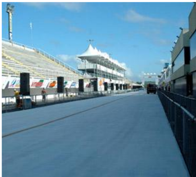
Figura 9 – Sambão do povo, Centro da Cidade de Vitória/ES

A inclusão do Sambão do Povo (Figura 9) neste mapeamento se deu pelos mesmos motivos que nos levou a incluir o Jardim da Penha, ou seja, a informação de que neste espaço há uma grande concentração de moradores de rua. O Complexo Walmor Miranda, também conhecido como Sambão do Povo, é o local dos desfiles das Escolas de Samba de Vitória, localiza-se no Bairro Mario Cypreste, na Grande Santo Antônio. Foi inaugurado em 1987, sendo palco de Carnaval. Em 1992 os desfiles foram paralisados e o Carnaval só retornaria ao Sambão em 2002. 15