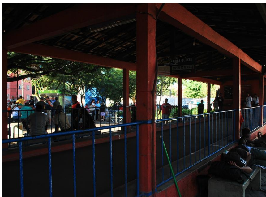
Figura 11 – Campo de Bocha, Praça dos Eucaliptos, Maruípe, Vitória/ES