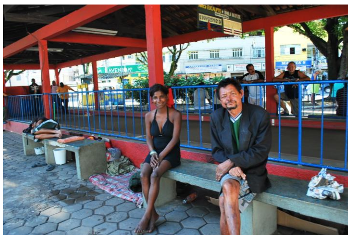
Figura 12 – Moradores de rua, Praça dos Eucaliptos, Maruípe, Vitória/ES