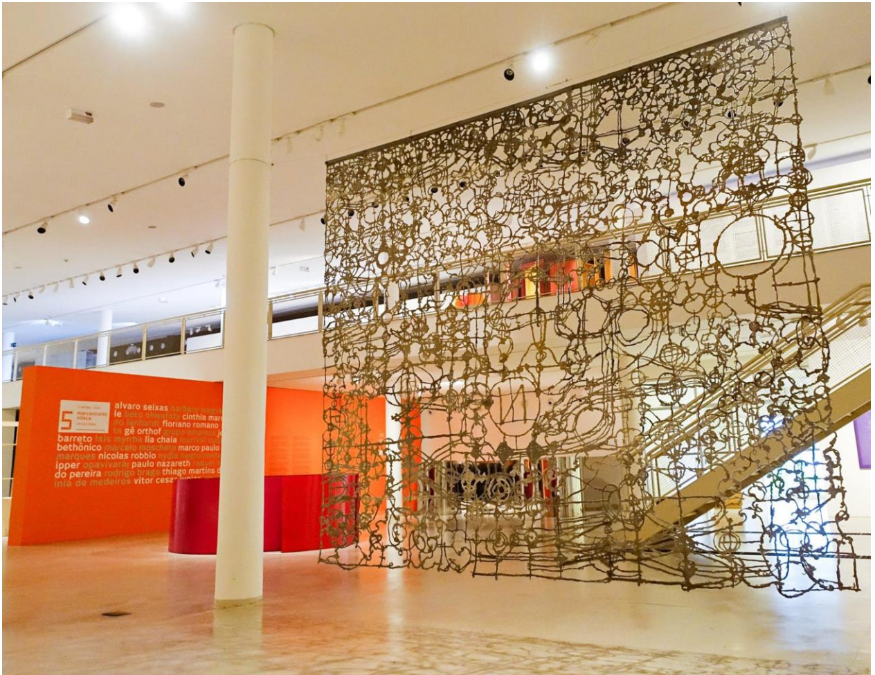
Figura 4 - Hilal Sami Hilal. Instalação , 1998. Celulose, pigmentos, resina, pó de ferro, pó de alumínio, tamanho variado.