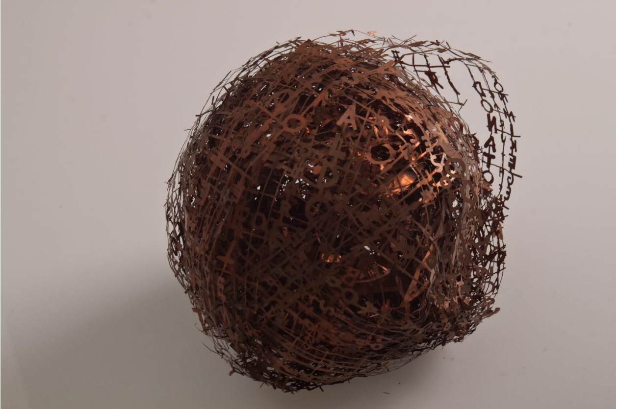
Figura 3 - Hilal Sami Hilal. Livro Redondo , 2005. Cobre, 25 cm de diâmetro.