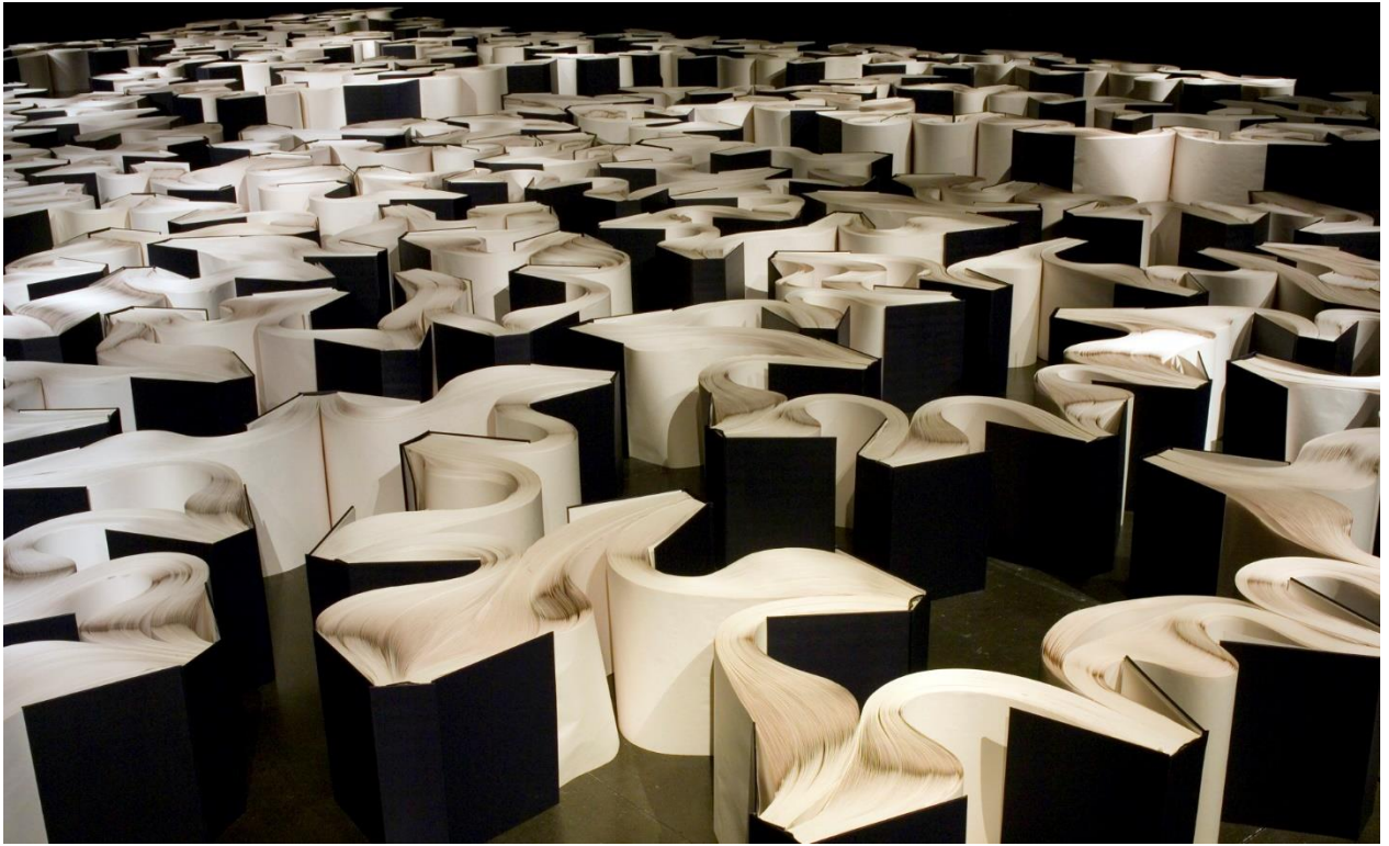
Figura 2 – Hilal Sami Hilal. Sherazade , 2003. Papel e encadernação, tamanho variado.