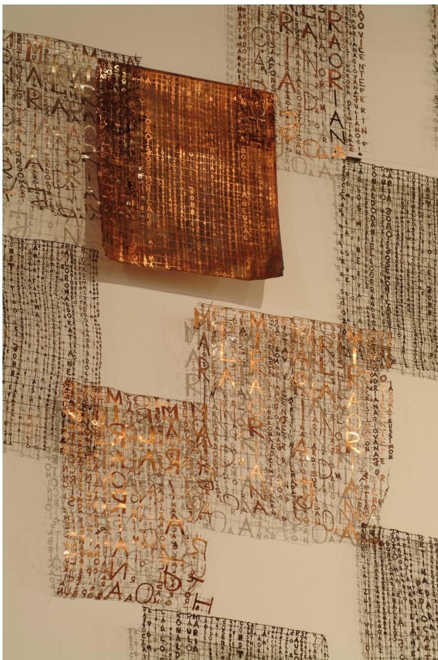
Figura 1 – Hilal Sami Hilal. Instalação RH , 2003. Cobre, tamanho variado.