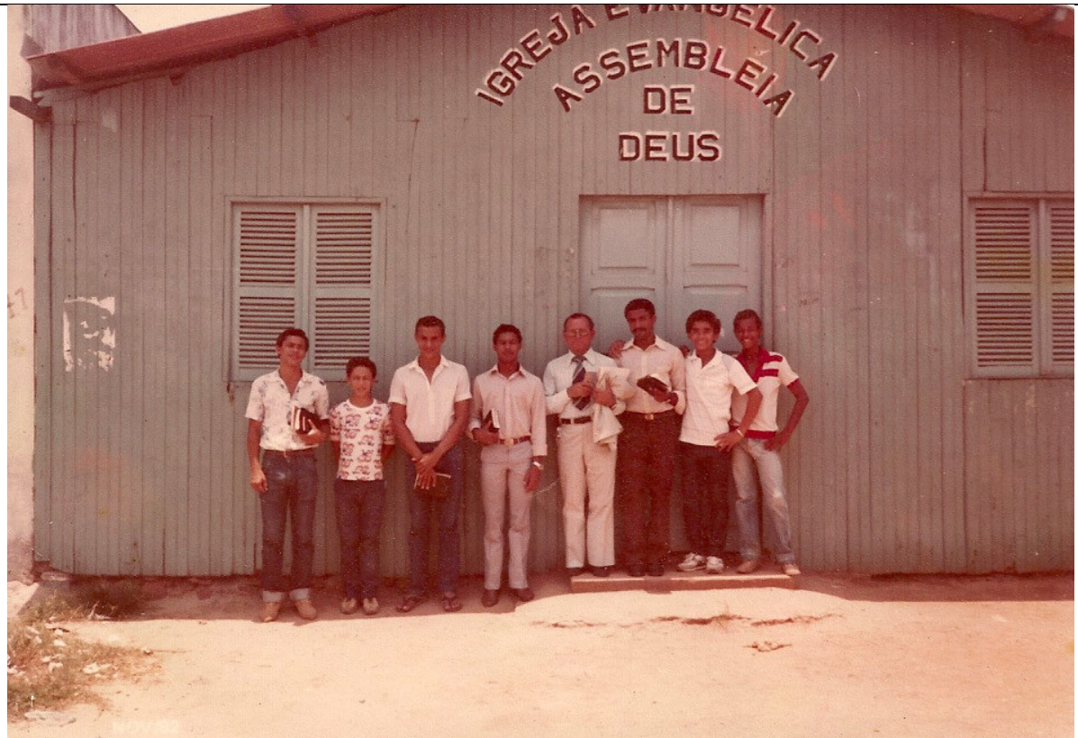
FIGURA 1 PASTOR E MEMBROS DO PRIMEIRO TEMPLO DA AD EM VITÓRIA

Saturnino de Brito e visava desafogar a pressão exercida pelo crescimento populacional de Vitória através de aterros de áreas baixas (VENTORIM & PROTTI, 1993, p. 9).