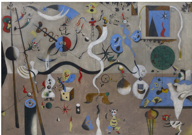
Figura 1 – Carnaval do Arlequim (1925), pintura a óleo de Joan Miró