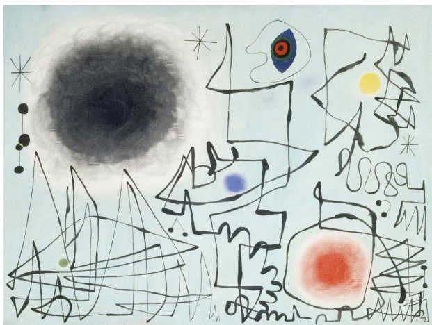
Figura 2 – O diamante sorri ao crepúsculo (1947), pintura a óleo de Joan Miró