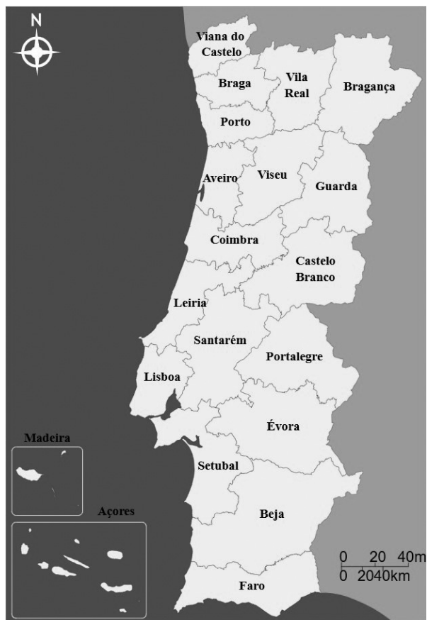
Figura 2: Divisão administrativa de Portugal

Sobre o contexto geopolítico de Portugal, seu nome oficial é República Portuguesa. Está localizado no sudoeste do continente europeu e sua capital é a cidade de Lisboa. A área territorial portuguesa, no total, é de 92.226 km 2 (noventa e dois mil duzentos e vinte e seis quilômetros quadrados), dividida por dezoito distritos no continente e duas regiões autônomas, Açores e Madeira: