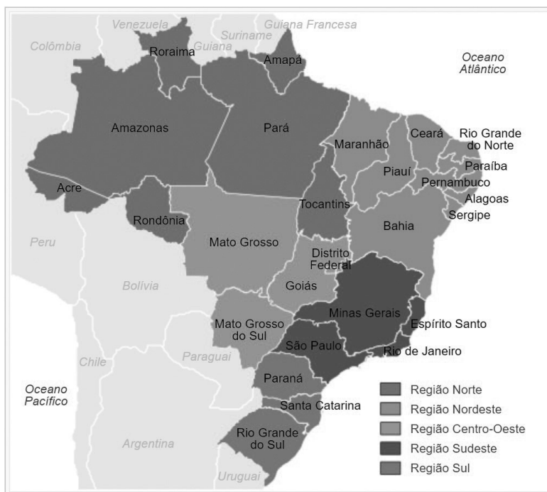
Figura 1: Mapa do Brasil e suas cinco regiões

Vale, neste momento, verificar as cinco regiões brasileiras, a Região Sudeste, o estado do Espírito Santo e o município de Vitória, onde está localizada a Secretaria Municipal de Educação, em que atuavam os professores de Educação Especial participantes do estudo.