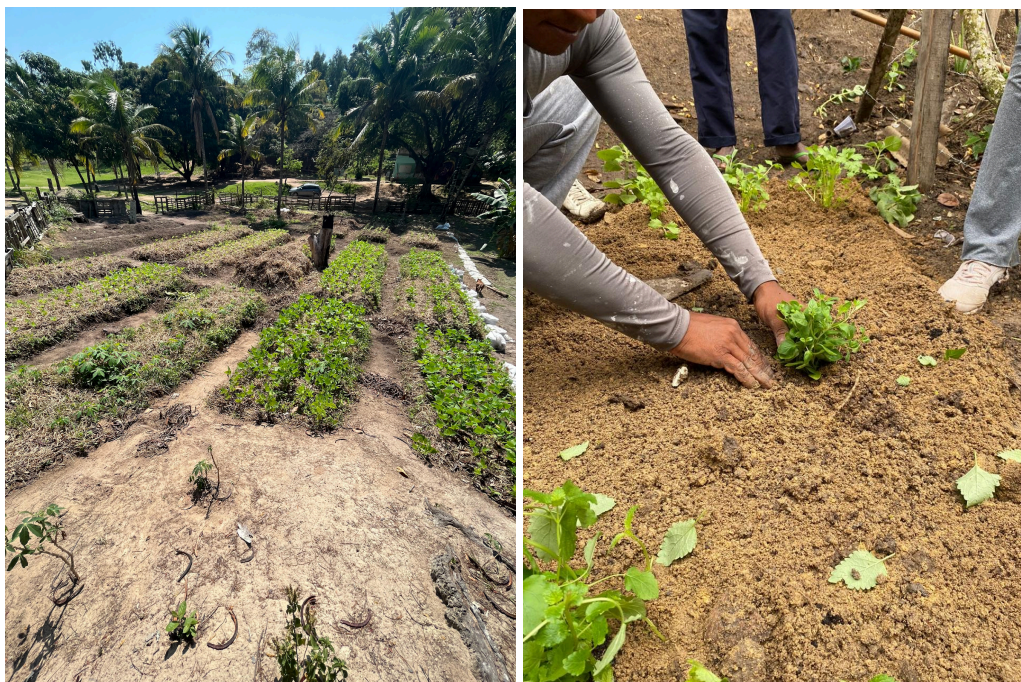
Figuras 6 e 7 - Horta comunitária