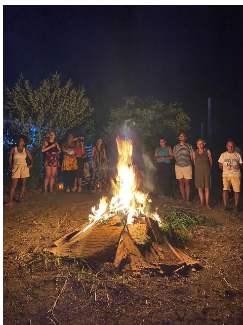
Figura 8 - Encontro do grupo de leitura: fogo

Nossos encontros aconteceram no Quintal Quilombo e na Casa Verde — espaços de afetos e confluências da Vila— e, no último encontro, uma grande festa se formou. Ao som de música, comida e uma fogueira noturna foram celebrados e plantados sonhos e desejos de futuro vinculados àquela terra que pisávamos, ao ar que sentíamos perfumado de Almesca 8 e ao fogo da fogueira que nos aquecia (figura 8). Se por um lado este grupo não foi concebido de início como campo exclusivo de aproximação desta pesquisa, por outro, foi uma experiência marcadamente transformadora, da qual surgiram faíscas de análise para compor o Projeto de Pesquisa — dando pistas para os caminhos que tínhamos a intenção de percorrer para o restante do trajeto desta dissertação.