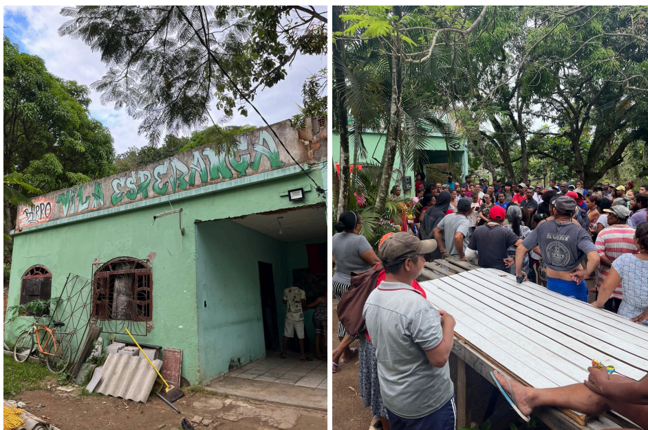
Figuras 10 e 11 - Casa Verde

construção — com exceção da Casa Verde (Figuras 10 e 11), única casa já existente no terreno antes mesmo da formação da Vila Esperança e que, posteriormente, passou a abrigar a sede da Associação de Moradores. Com a consolidação da ocupação, outros formatos de construção passaram a existir, como casas de alvenaria e de barro (bioconstrução), modificando, assim, a estética do território no decorrer do tempo. Certo dia, Ione e Simba me explicaram que, no caso da Vila, as casas bioconstruídas de barro tendem a ser mais resistentes do que as de alvenaria, pois como boa parte dos moradores não têm dinheiro para ter acesso a vigas metálicas, diversas construções de alvenaria acabam ficando com estruturas fragilizadas, em oposição às casas de barro, que possuem uma estrutura mais firme feita de madeira.