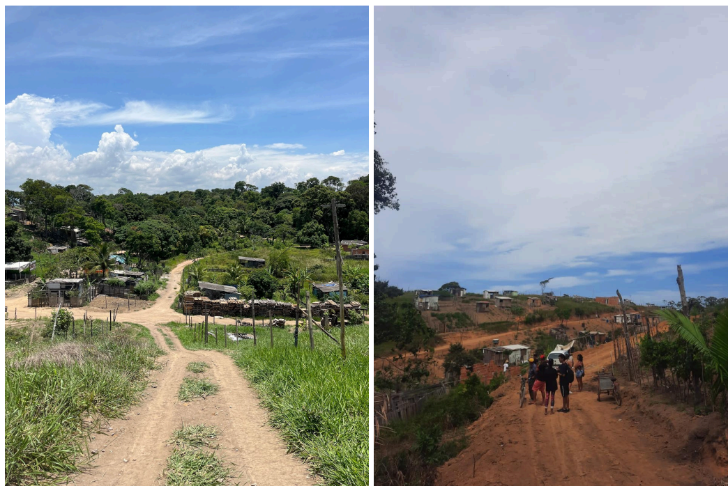
Figuras 4 e 5 - Vila Esperança, chão de terra

imobiliárias legais nessas localidades. Dessa forma, a Vila é uma ocupação que se consolidou atravessada pelas questões ambientais, seja através do discurso institucionalizado de protecionismo ambiental, seja através das práticas cotidianas intimamente ligadas à ecologia e à natureza local.