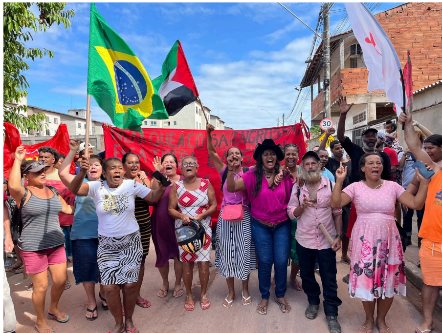
Figuras 15 e 16 - A comemoração da suspensão do despejo