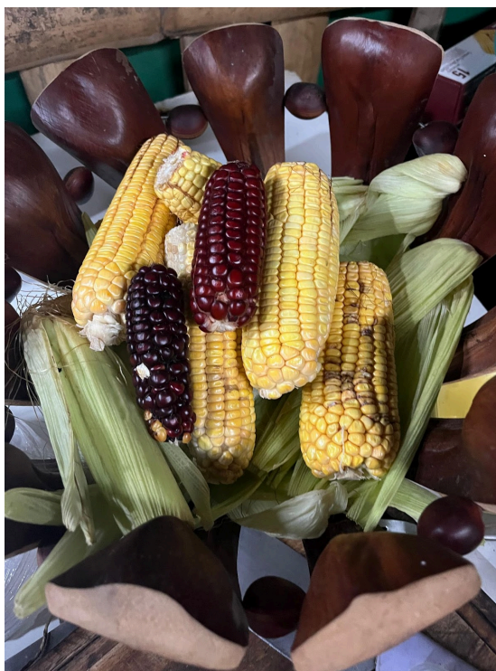
Figura 2 - Variedade de milho crioulo colhido do Quintal Quilombo

carregam não só um valor nutricional, mas também histórico, social e cultural, de preservação da memória e, ao meu entender, da ancestralidade. Assim sendo, cabe uma reflexão: considerando o termo “crioulo” um homônimo, frequentemente utilizado no Brasil para também se referir a pessoas negras, quais relações podemos estabelecer entre a descrioulização das sementes e os processos de branqueamento da população negra no Brasil?