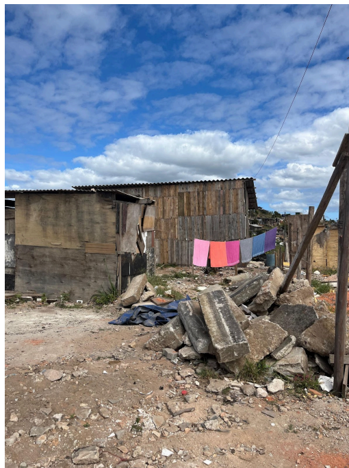
Figura 12 - Casas no Bota Fora

Bota Fora, ilustrado na figura 12, fica localizado em uma ocupação vizinha à Vila, chamada Vale da Conquista 13 , e recebe esse nome por ser um terreno em que caminhões despejam e empilham entulhos e sobras de obras externas a essas ocupações.