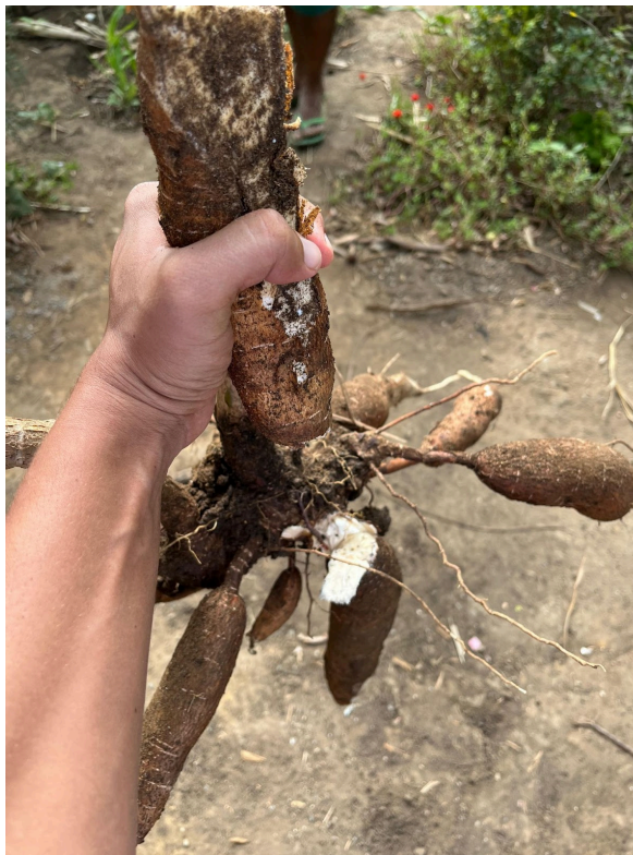
Figura 1 - Mandioca colhida do Quintal Quilombo