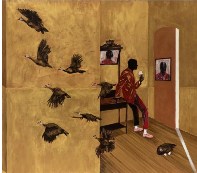
Imagem 2: Desdobramentos sobre sankofa