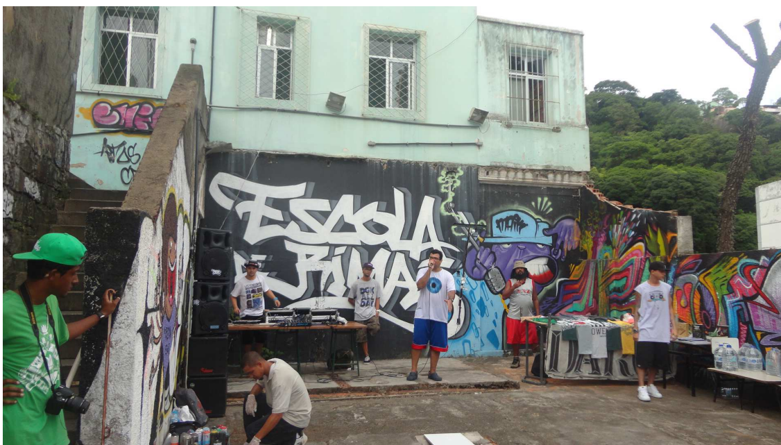
(Fig. 21 - Mc Adikto no comando da Escola de Rimas.)

Após a apresentação de duas músicas de rap, por um grupo de São Paulo que estava em visita à Vitória, iniciou-se a “Batalha do Vocabulário”. Cada batalha envolveria dois mc’s, já inscritos e devidamente sorteados em duplas. A batalha que analiso a seguir foi a 3ª daquele dia e reuniu os mcs que venceram as suas respectivas batalhas e agora iriam duelar entre si. Chamarei os duelantes dessa batalha de mc C. A. e mc L. 21