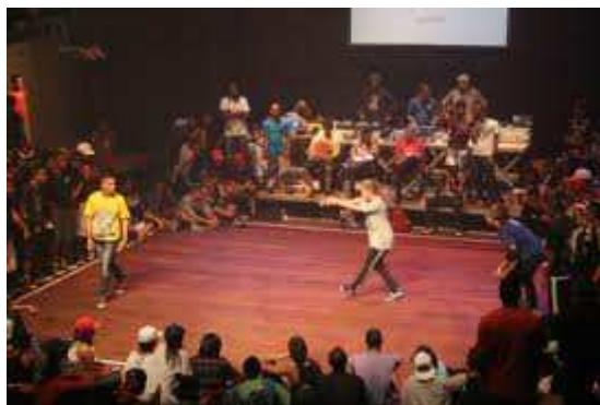
(Fig. 5 – Dança de rua)

Ainda conforme Mariaca (2005), o break representa o corpo através da dança, o MC (mestre de cerimônia) é a consciência, o cérebro do hip-hop, o DJ (disc jockey) é a essência, a alma, a raiz, e o grafite (desenhos, pinturas em murais) é expressão da arte, o meio de comunicação.