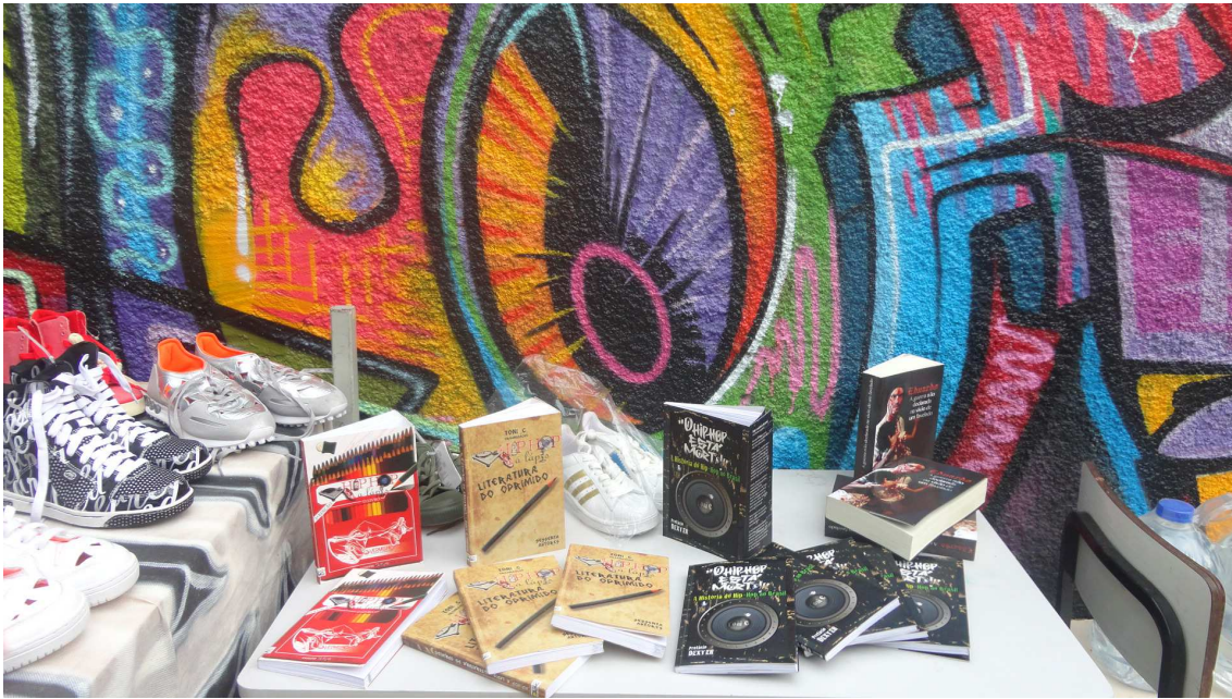
(Fig. 8 - Exposição de livros durante o projeto “Escola de Rimas”)

Mais do que “multiletradas”, como propõem as novas teorias do letramento, gostaria de pensar as práticas discursivas do movimento hip hop como práticas multilanguageiras , isto é, práticas discursivas de múltiplas linguagens, oral, escrita, musical, pictórica, corporal, gestual, estilística.