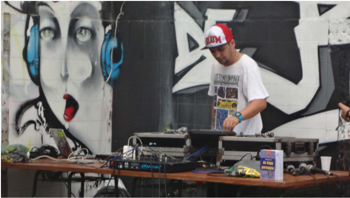
(Fig. 1 - Dj em atividade em um dos eventos da “Escola de Rimas”)