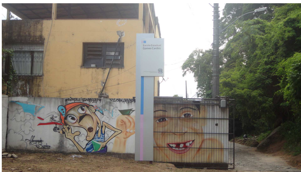
(Fig. 15 - Imagem do muro e do portão principal da E. E. Gomes Cardim, vistos do interior da escola.

Os elementos da cultura hip hop se fazem presentes por todo o espaço da escola, inclusive antes de se chegar a ela; na rua Wilson de Freitas, que dá acesso à escola, há uma carcaça velha de ônibus desenhada com grafite. Desde o portal da escola, a arte do grafite a “invade”, interagindo com ela, integrando-se a ela, estabelecendo um diálogo cujo efeito de sentido merece alguma reflexão.