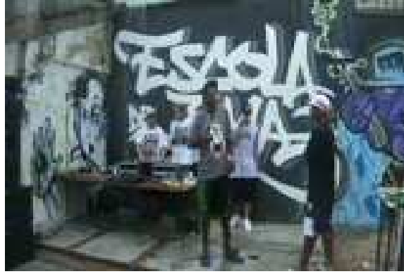
(Fig. 22 - Uma “Batalha de Rimas” acontecendo.)

Um outro aspecto importante a se destacar nas batalhas é a explicitação da natureza de acontecimento da linguagem, para além de uma concepção tradicional normativo-prescritiva, sempre muito preocupada em controlar as formas e os conteúdos linguísticos. As batalhas, ao contrário, e isto é um princípio do próprio gênero rap, exigem dos mcs um processamento dinâmico da linguagem, já que, diante de um tema que emerge aleatoriamente, o enunciador precisa construir seus versos, com sentido, isto é, dentro de um todo coerente, e composicionalmente estruturado no interior do gênero rap: um enunciado versificado, rimado, etc.