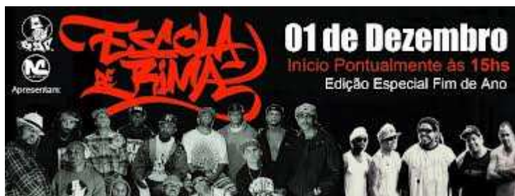
(Fig. 11 - Imagem de cartaz de um dos eventos da “Escola de Rimas”. )

A imagem abaixo é a de um cartaz de uma das edições do evento, realizado em 2012, na Escola Estadual Gomes Cardim, do município de Vitória-ES.