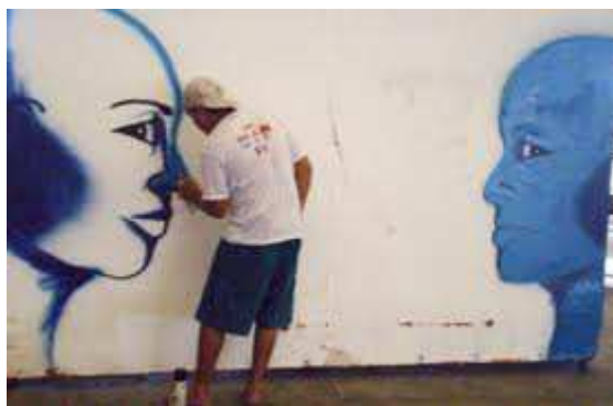
(Figs. 3 e 4 – Os elementos do hip hop )