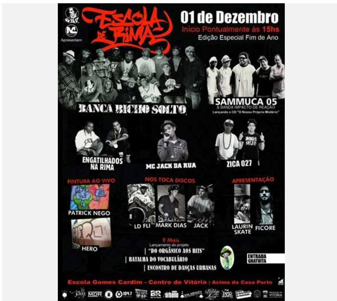
(Fig. 10 – Cartaz do evento Escola de Rimas Especial Fim de Ano)

A seguir, exemplificamos com uma imagem da página do projeto Escola de Rimas e do MC Adikto ( http://www.facebook.com/events/222021957931657/ ):