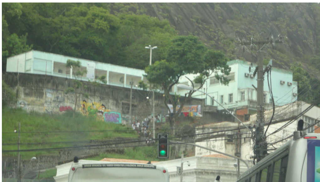
(Fig. 14 - Foto da E. E. Gomes Cardim, vista da Av. Princesa Isabel. Foto da autora)

Princesa Isabel, no Centro de Vitória. Logo em seguida, foi novamente transferida, agora para a Cidade Alta, ainda no centro de Vitória-ES, ao lado do Parque Municipal da Gruta da Onça e abaixo do Parque da Fonte Grande, como mostra a foto abaixo.