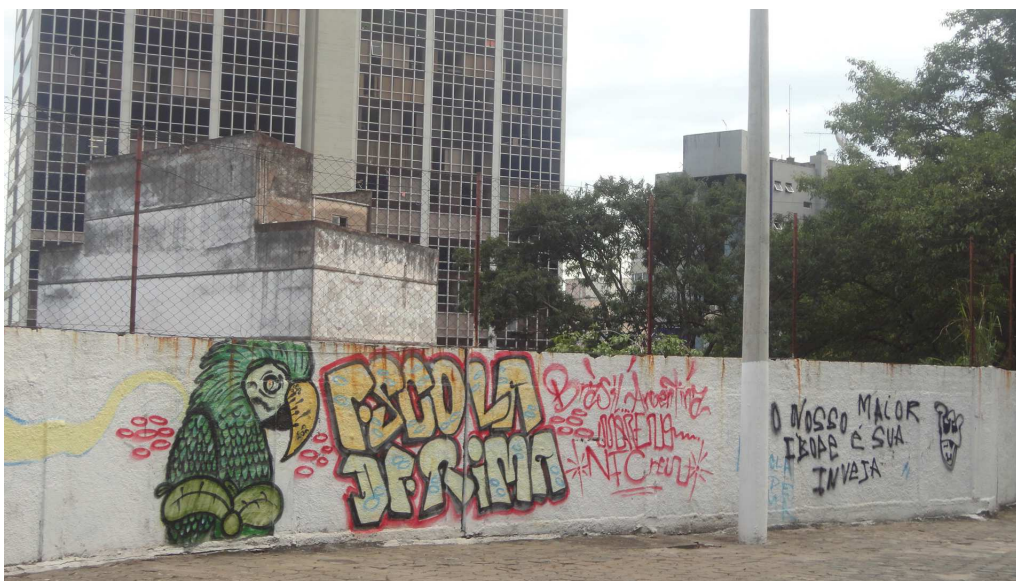
(Fig. 20 - Grafite pintado no muro interno da E. E. Gomes Cardim. Foto da autora)

Não deixa de ser curioso que a escola que esteve tão próxima das artes clássicas, como a música e o teatro, abrigue, agora, em seu interior uma outra forma de arte, marginalizada, nascida nas ruas, nos guetos, nos morros, nas periferias das grandes cidades, produzida por sujeitos que, muitas vezes, mal frequentaram a escola formal, e quase sempre não conhecem as artes clássicas. Entretanto são esses sujeitos que estão ali a propor um espaço extra-oficial de educação pela arte, através do grafite, do rap, da dança de rua, de sua literatura marginal, entre outras formas de expressão.