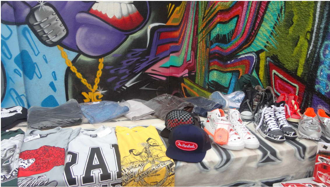
(Fig. 9 - Exposição de peças de vestuário da cultura hip hop durante um evento da Escola de Rimas)

Voltarei a essas questões ao analisar o evento “Escola de Rimas”, no qual todas essas múltiplas linguagens e semioses (cds, fanzines, livros, roupas, acessórios, grafites, música, raps, rimas, etc.) acontecem ao mesmo tempo, em um mesmo lugar, ou seja, no mesmo cronótopo.