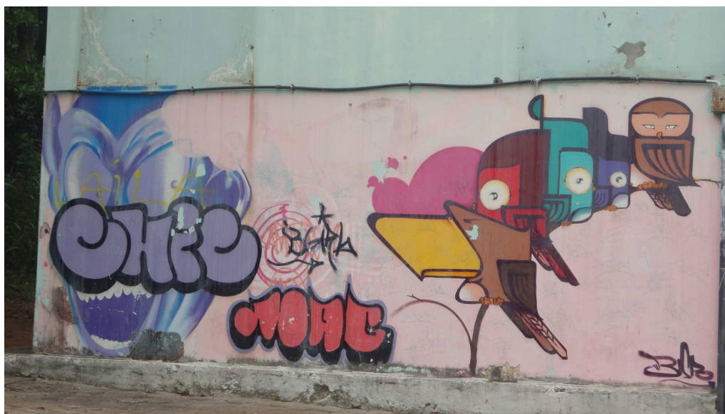
(Fig. 19 - Grafite pintado na parede do prédio principal da E. E. Gomes Cardim. Foto da autora)

Essas relações não me parecem meras coincidências. Ao contrário, elas parecem indicar, ou indiciar, conforme Ginzburg (1986), um diálogo sempre presente na “alma” da Gomes Cardim. Se antes esse diálogo se daria entre arte, cultura e educação no sentido mais erudito desses termos, e com o apoio dos órgãos oficiais, agora, sem este apoio e sem o mesmo aspecto erudito, esse espaço continua com o mesmo “espírito” voltado às manifestações artísticas, ainda que para muitos, possa parecer uma arte meio “às avessas”. Este espaço, seja pela sua história, seja pela sua condição de marginalizado, seja pelos seus agentes e, sobretudo, pelo conjunto da obra, é que tem tornado possível a interferência, a intervenção, o diálogo entre o formal e o informal, abrigo ou ao menos deixando que lhes insiram a arte do movimento hip hop, como podemos encontrar por toda a escola, no portão de entrada, na parede do prédio principal, nos muros da escola, convivendo mesmo com os signos do poder oficial, com os problemas de infraestrutura e, também, com o conhecimento instituído.