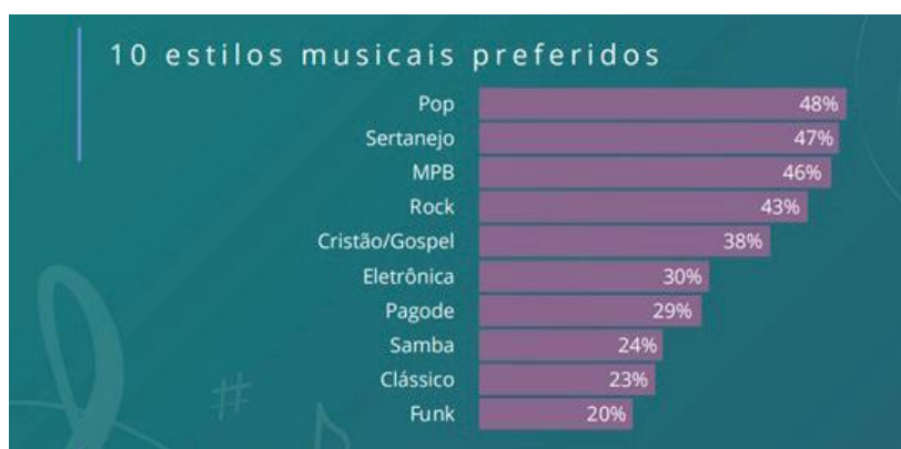
Figura 1 – Dez estilos musicais preferidos

Um medidor dessas informações são as pesquisas de monitoramento. De acordo com o infográfico 16 produzido pela Opinion Box em 2019, no qual apresenta o comportamento do consumidor de música, 52% do público consumista são mulheres; a faixa etária dos ouvintes em geral está entre 30 a 39 anos, totalizando 29% dos ouvintes; a região Sudeste corresponde a 51% dos consumidores; 76% dos ouvintes representam as classes sociais C, D e E; 86% ouvem músicas pelo celular; 71% costumam ouvi-las enquanto arrumam a casa, entre outras sondagens. Em relação aos estilos musicais preferidos está o sertanejo, totalizando 47%, conforme Figura 1.