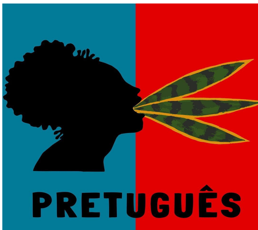
Imagem 9. Pretuguês 24 a bandeira.

Pretuguês: “Na verdade, Palmares foi berço da nacionalidade brasileira. E o mesmo se pode dizer com relação aos quilombos, onde a língua oficial era o ‘pretuguês’, e o catolicismo (sem os padres, é claro) a religião comum” (GONZALEZ, 2020, p.51).