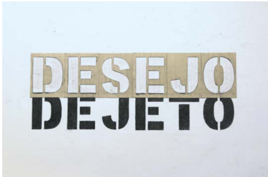
Imagem 9 - Deslizes de uma economia erótica colonial, Millena Lízia (2019)