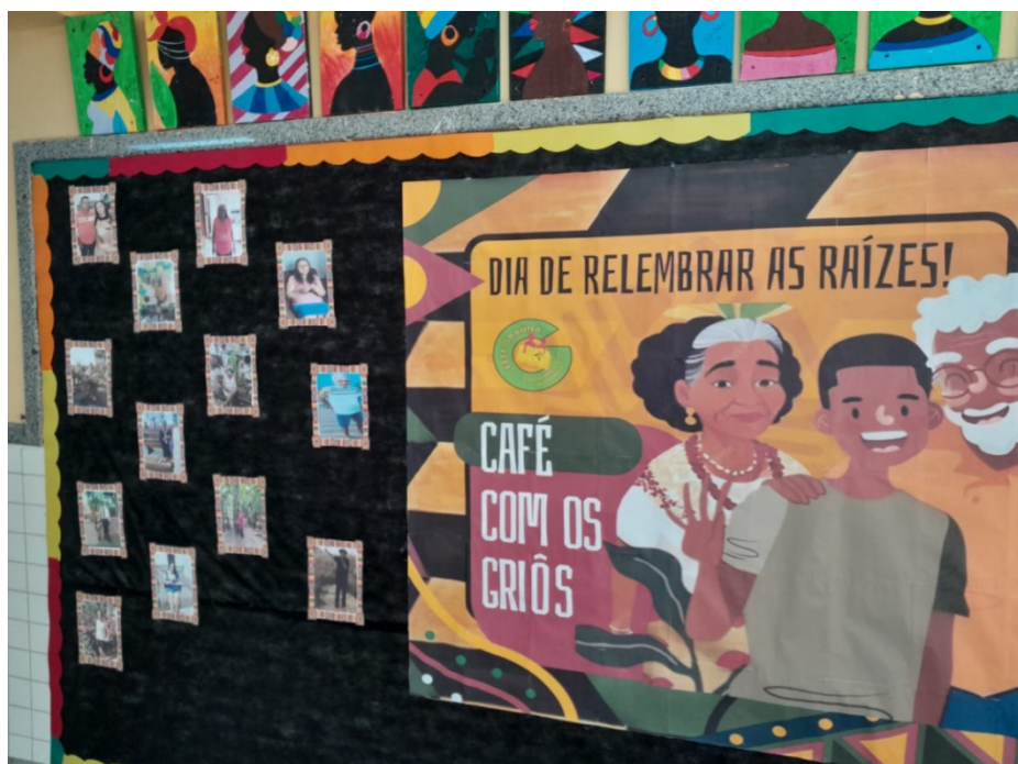
FIGURA 2: CAFÉ COM OS GRIÔS 2024 I – PROJETO DA EEEF GRAÚNA

respeitando tanto a herança africana quanto as particularidades locais, tendo em vista que a própria comunidade objeto de estudo já utiliza o termo em suas atividades, conforme podemos verificar nas imagens a seguir.