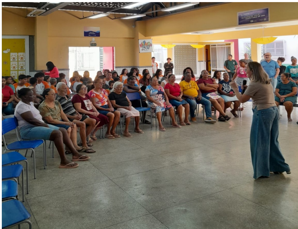
FIGURA 4: CAFÉ COM OS GRIÔS 2024 III – PROJETO DA EEEF GRAÚNA