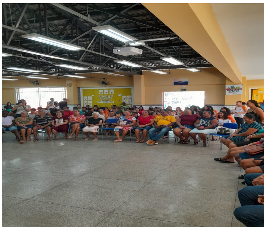
FIGURA 3: CAFÉ COM OS GRIÔS 2024 II – PROJETO DA EEEF GRAÚNA