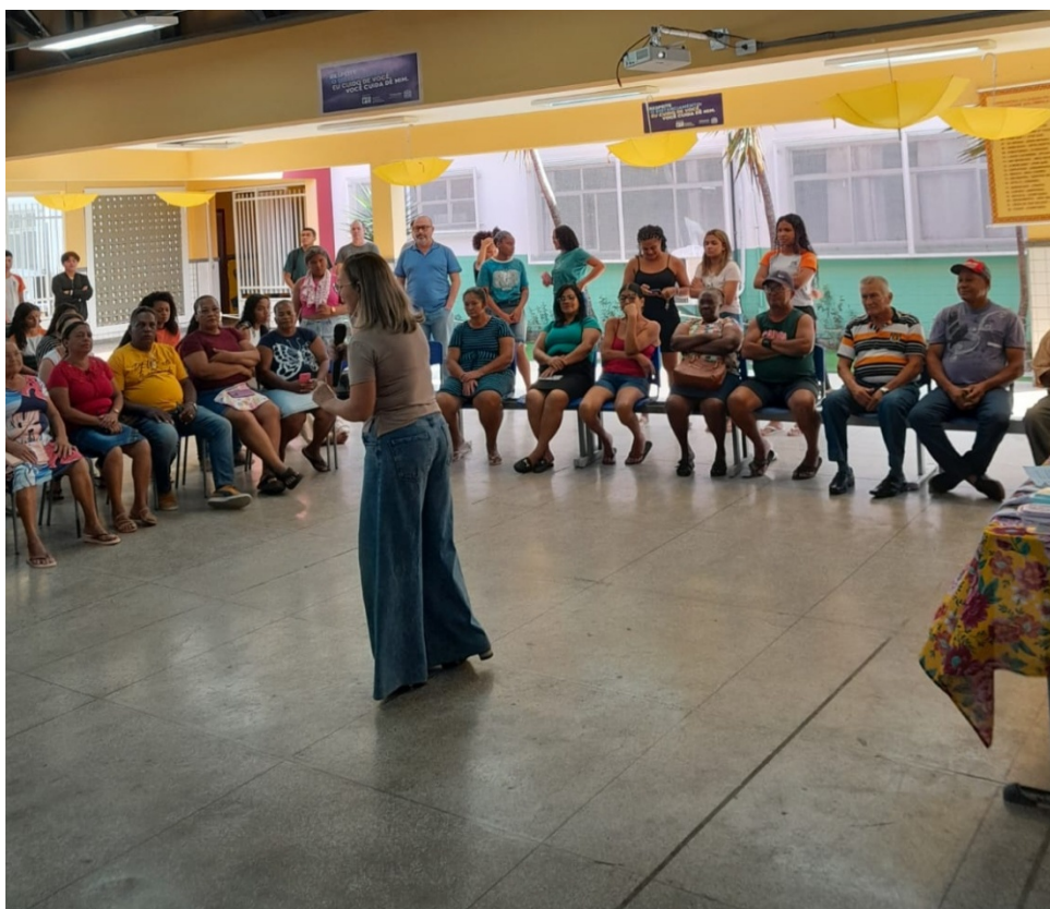
FIGURA 5: CAFÉ COM OS GRIÔS 2024 IV – PROJETO DA EEEF GRAÚNA