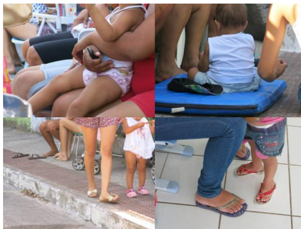
Imagem 8 – Crianças acompanhadas de seus familiares na fila de vagas para matrículas