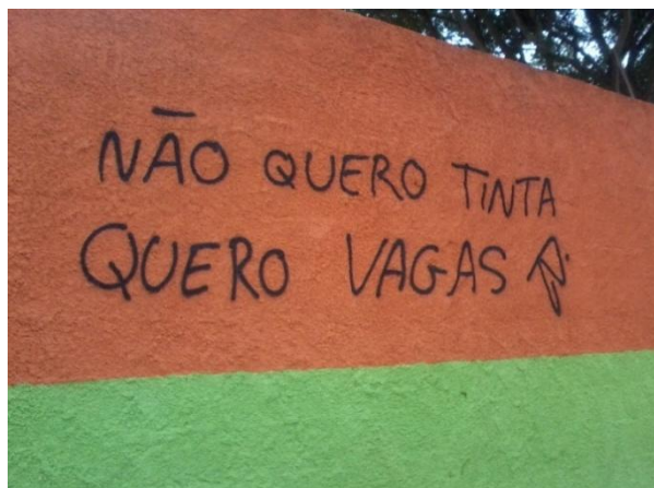
Imagem 1 – Muro de um CMEI localizado na Grande Vitória