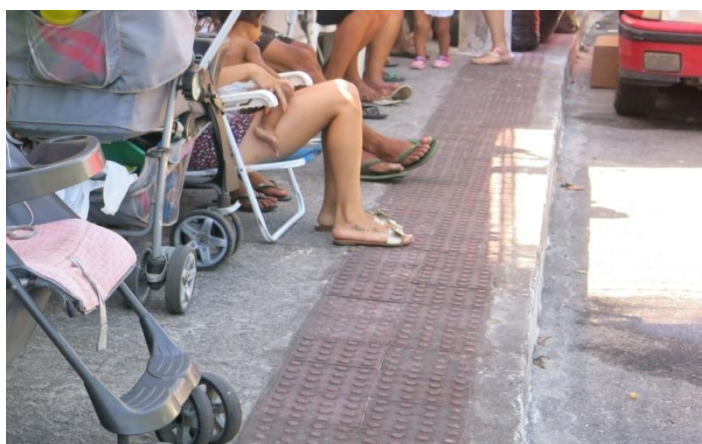
Imagem 4 – Fila de vagas para matrículas em uma instituição de EI da Grande Vitória