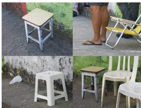
Imagem 5 – Bancos e cadeiras levados pelos familiares para fila de vagas

Era um dia de muito sol e pouco vento, um dia típico do calor do final da primavera de novembro no Brasil, vento pouco, quase inexistente, as poucas sombras iam cedendo lugar ao sol no avançar da tarde, de modo que a fila teve de alterar de calçada. Nesse contexto, de muitos ruídos e olhares com distintas nuances, realizávamos a pesquisa nos atropelos entre as cadeiras de praia, colchonetes, cadeiras, mesas, carrinhos de bebê, como podemos ver na imagem a seguir, que captamos durante a imersão a campo: