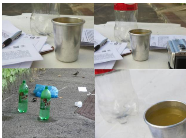
Imagem 6 – Bebidas na fila de vagas para matrículas

com o outro, sentamos juntos nas calçadas e, nesses bancos, buscamos manter a horizontalidade no olhar, cuidando para estar no mesmo nível dos olhos dos sujeitos. Tudo isso compõe o cenário da pesquisa e identifica o contexto e a metodologia realizada, conforme as imagens que seguem: