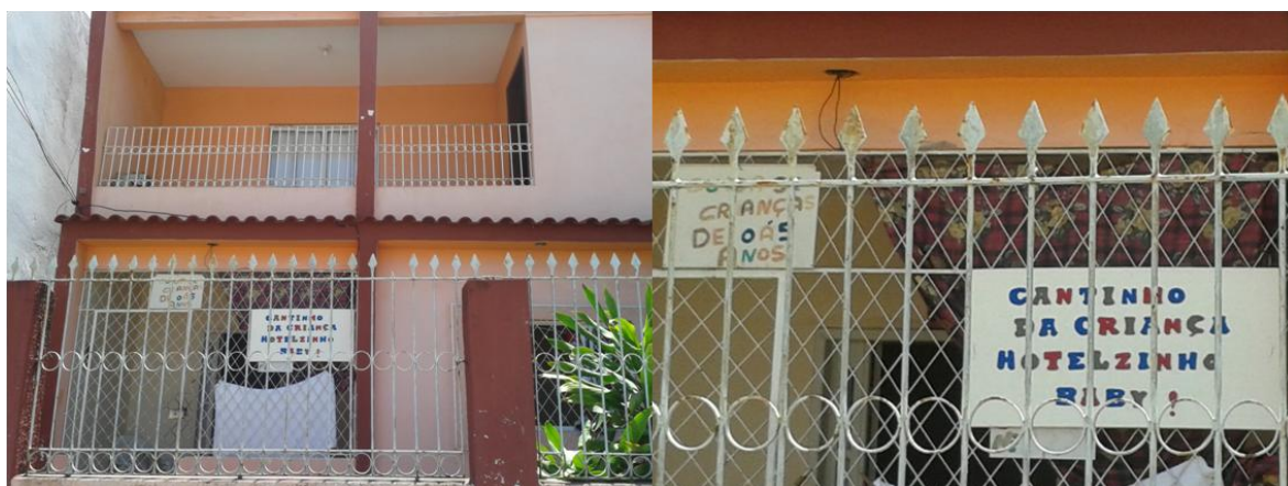
Imagem 3 – Casa localizada na Grande Vitória