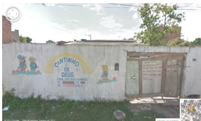
Imagem 2 – Muro localizado na Grande Vitória