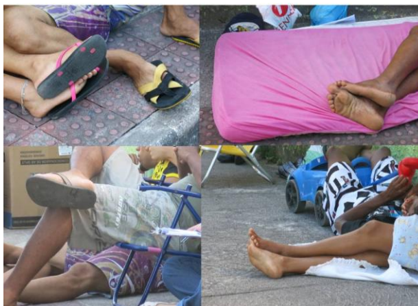
Imagem 7 – Sujeitos durante a fila de vagas para matrículas

vezes com as crianças no colo, sendo o corpo, o principal indicador dessa disposição, conforme informam as imagens a seguir.