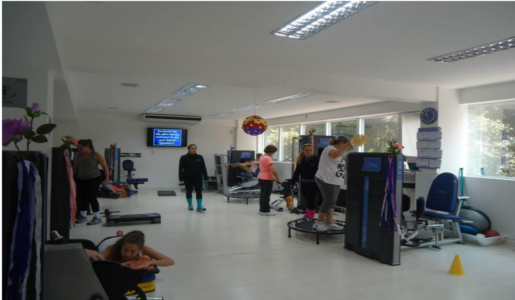
Figura 3 - Sala do Circuito.

Diante desses pressupostos e em consonância com o layout do site da academia, há a predominância de tons rosa, lilás e roxo. Flores nas cores rosa e lilás que enfeitam a sala do circuito e a academia como um todo indicam que ali é um ambiente feminino. De acordo com Rocha (2011, p.26), desde a infância, na classificação do gênero, “[...] o rosa surge como a cor que representa a construção identitária feminina, diferenciando-se da masculina em vários aspectos”.