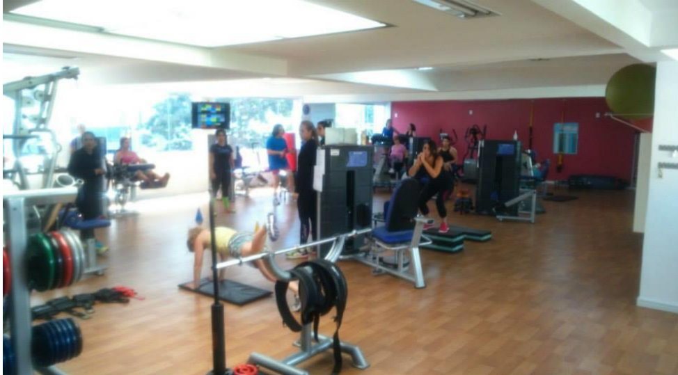
Figura 9 - Área destinada ao circuito funcional.

As mudanças observadas sobre a parte física do novo espaço projetam-se também em mudanças na metodologia. A aluna agora tem a opção de realizar o circuito ou fazer a musculação, ficando a critério de seus objetivos. Em conversa com Juliana a respeito da introdução da musculação, ela disse que