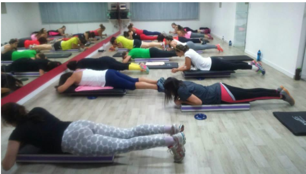
Figura 7 - Sala de aulas coletivas.

À esquerda, localizam-se os banheiros, bem amplos, conferindo mais conforto às alunas, mas mantendo o mesmo padrão com sanitários, chuveiros e armários individuais. Ao sair do banheiro, ao lado se vê a novidade da academia, a sala de spinning . Essa sala também é fechada com vidros, possibilitando a visão das bicicletas estacionárias e toda sua estrutura.