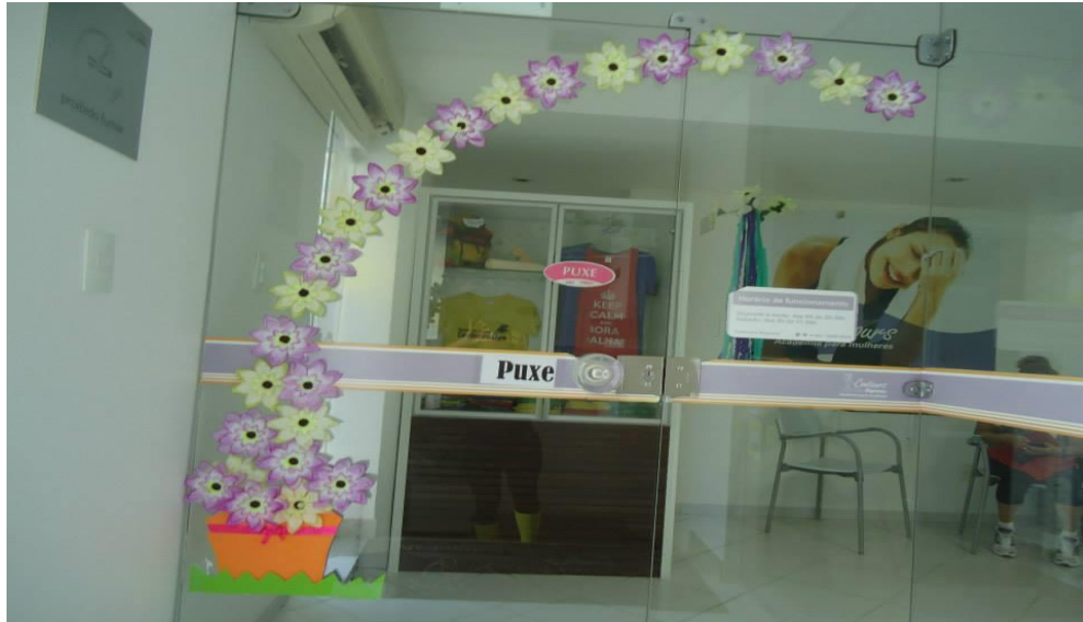
Figura 2 - Recepção da Contours.

É possível se comparar esses artigos personalizados da academia com aqueles produtos de fácil acesso nos caixas de padarias, supermercados e restaurantes. Localizados em locais onde são efetuados os pagamentos, artigos como balas, chocolates, revistas, bebidas são itens comuns encontrados próximos ao caixa, e pelo tempo de espera na fila, há a possibilidade de interesse por algum deles e, conseqüentemente, os indivíduos podem levá-lo sem terem planejado, ou seja, há chances de estarem comprando por simples impulso.