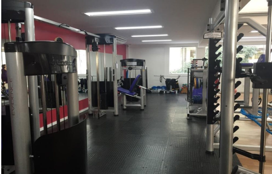
Figura 8 - Musculação.

panóptico. Ou seja, um sistema em que a partir de determinado ponto permite avistar todo o interior de um local. Essa visão do todo que as professoras possuem é estabelecida através do uso dos espelhos. As professoras –os guardas- monitoram as alunas a fim de manter o controle e a ordem dos seus corpos.