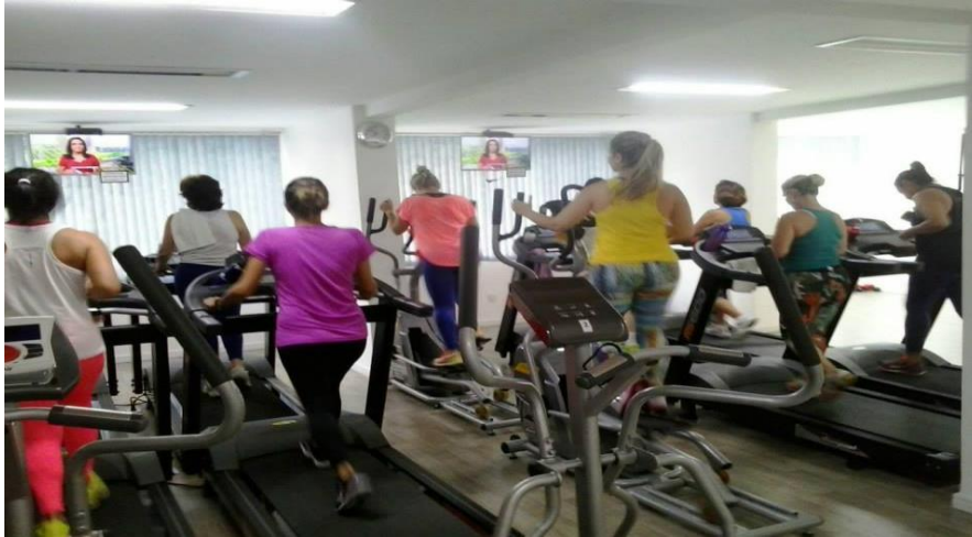
Figura 6 - Sala de Cardio.

À esquerda, localizam-se os banheiros, bem amplos, conferindo mais conforto às alunas, mas mantendo o mesmo padrão com sanitários, chuveiros e armários individuais. Ao sair do banheiro, ao lado se vê a novidade da academia, a sala de spinning . Essa sala também é fechada com vidros, possibilitando a visão das bicicletas estacionárias e toda sua estrutura.