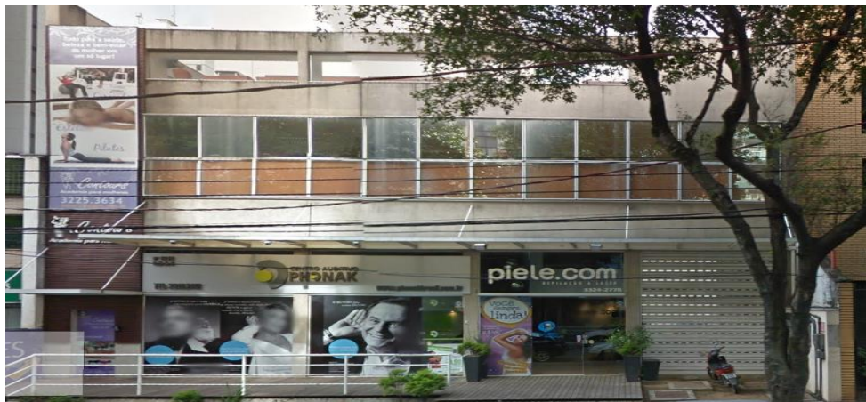
Figura 1 - Prédio da Contours situado na Av. Rio Branco.

Como combinado, compareci a minha primeira aula na academia no dia 29/09/2014, no período dos dez dias gratuitos. Fui bem recebida pela secretária que havia me atendido, e pelas três professoras que compõem o turno matutino. Ao preencher o meu cadastro na secretaria, obtive minha primeira percepção sobre o ambiente. Bem limpo, climatizado e perfumado, sob o efeito de essências aromatizantes. Vale lembrar que essa primeira visita aconteceu no antigo endereço da unidade, na Avenida Rio Branco.