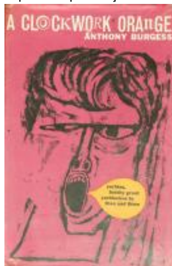
Figura 1 - Capa da primeira publicação de A Clockwork Orange .