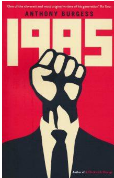
Figura 2 - Capa do livro 1985 .