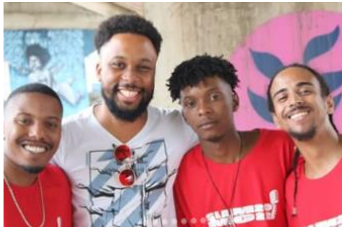
Figura 4 – Semifinalistas Slam da História

Nessa imersão pensante, questionadora e problematizadora sobre as relações que foram se constituindo no campo, no contato com os sujeitos, nas trocas de saberes; os afetos foram se mostrando a tinta que tingia a escrita do diário e que davam os rumos para as descobertas desse caminhar. O diário que confidenciava a partir desses afetos as percepções muitas sobre a presença, as inseguranças sobre um estar ou não em um suposto caminho correto, as dúvidas sobre a intencionalidade vs a potencialidade da pesquisa e autocrítica perante ela; é de fato o coração pulsante da caminhada, ou melhor a alma que reflete as percepções mais profundas sobre as vivências do corpo no campo (ROCHA;ECKERT, 2008), como “sentir-se um pouco de canto ao chegar em um evento’ um deslocamento por ser estranho àquele espaço; como ‘sentir-se acolhido nos cumprimentos e sorrisos após constantes participações’ uma aproximação e reconhecimento pelo contato; como ‘concordâncias e indignações mútuas expressadas nos entre olhares frente à situações de opressão’ e ‘nos diálogos produzidos a partir dos versos compartilhados que ecoavam uma luta conjunta’ uma identificação e confluência pelo sentir, partindo de um estranho à parte integrante” (DIÁRIO DE CAMPO, 2022). Como ilustrado na Figura 4, que demonstra a proximidade alcançada após uma caminhada conjunta.