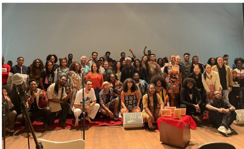
Figura 6 - Os artistas e a plateia. Ou seria o quilombo?