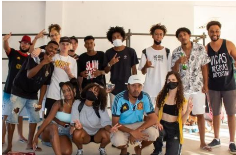
Figura 3 - Evento Sarau do Sararau realizado na praça Céu JF