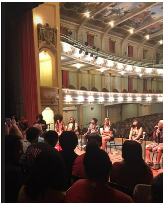
Figura 5 - Acústico Sararau Crioulos Cine Teatro Central JF

teatro ficou preto, isso com certeza é magia poética! [...] Ao longo do show eu lembrava da fala deles sonhando com esse momento, que veio, como anunciado, não para um, ou para outro poeta, mas para o Coletivo Poético-musical Sararau Crioulos (DIÁRIO DE CAMPO, 2023).