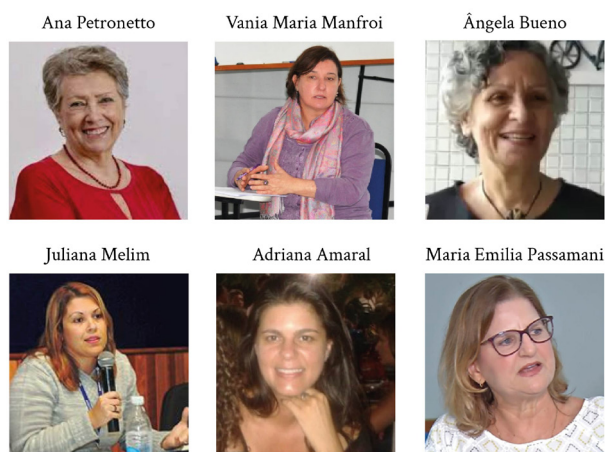
Figura 1 – Coordenadoras do Neca (1990-2023)