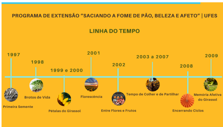
Figura 2 – Linha do tempo: programa de extensão “Saciando a fome de pão, beleza e afeto”

Ao narrar seus resultados, focalizamos as dimensões – convivência humana, formação profissional e produção do conhecimento –, conforme proposta pedagógica original. Apresentamos aqui o desenvolvimento do projeto sob a forma de linha do tempo.