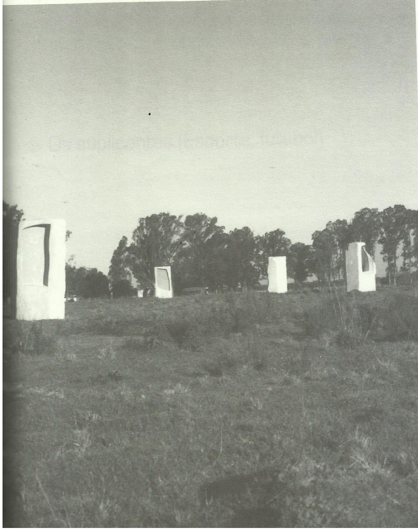
“Minuano” (RAMOS, 2007, p. 241)