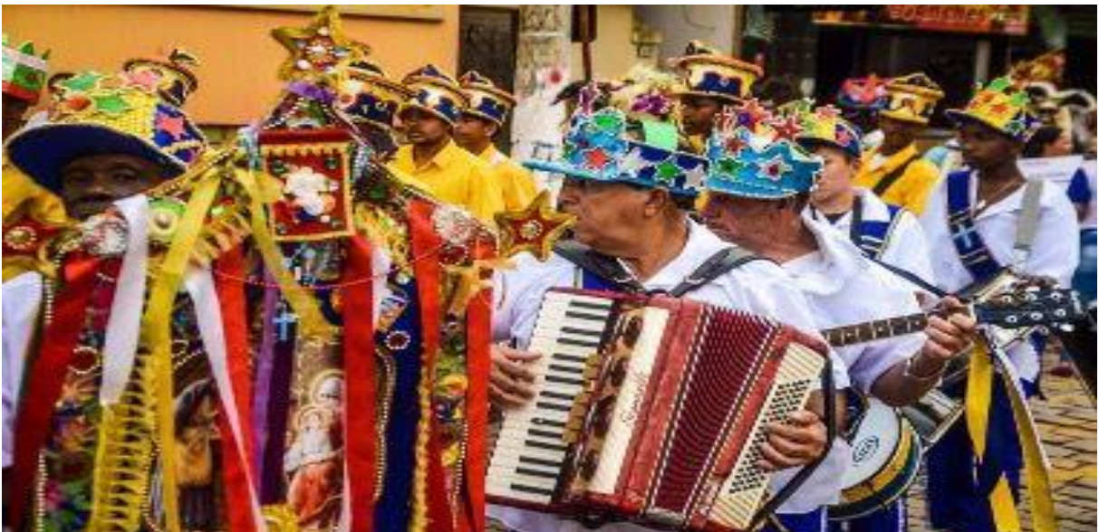
Figura 3 - Músicos populares e autodidatas - Festa de Folia de Reis