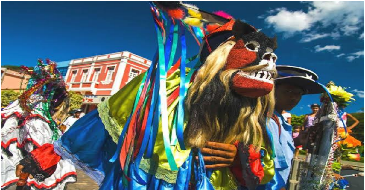
Figura 4 - Desfile de fantasias de Folia de Reis em Muqui