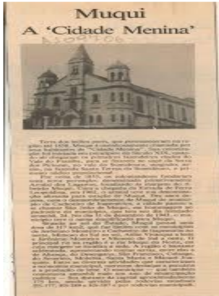
Figura 5 - Jornal Muguense de 1914