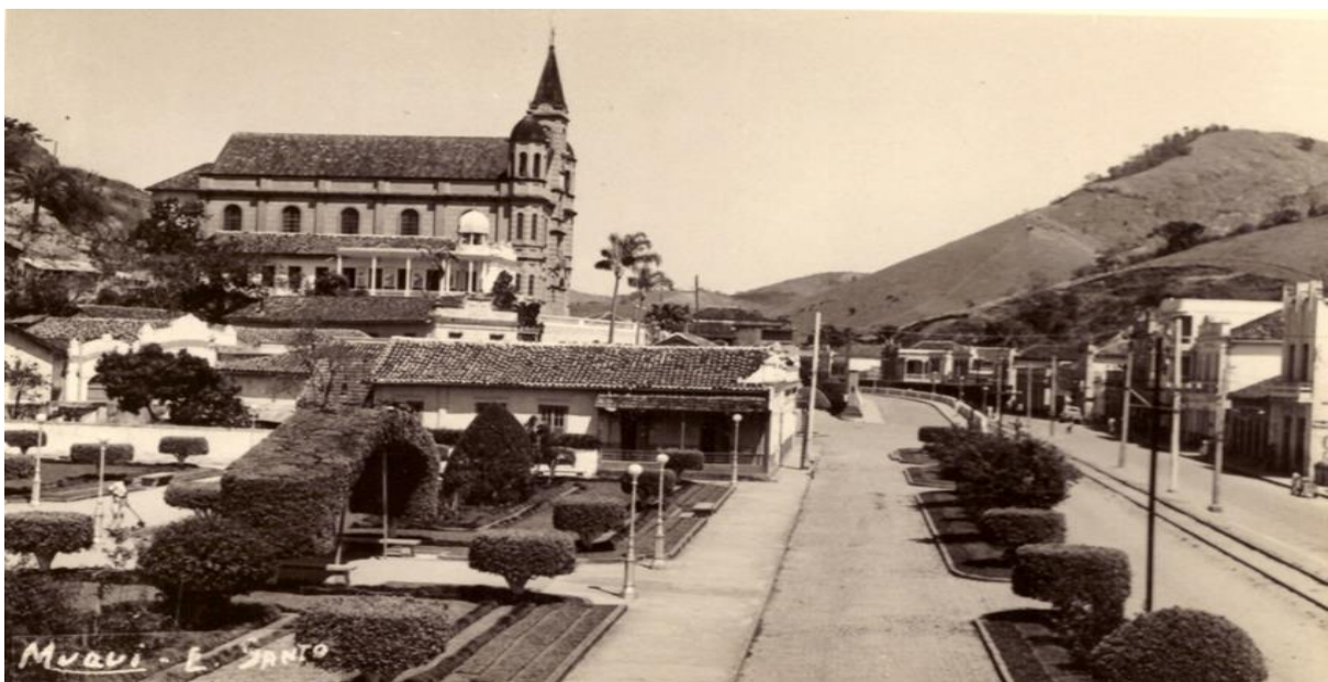
Figura 2 - Município de Muqui: suas primeiras construções