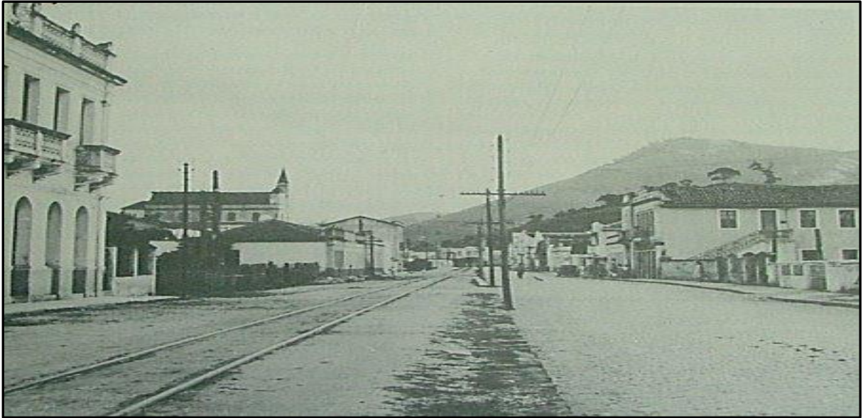
Figura 1 - Primeira Estação Ferroviária de Muqui