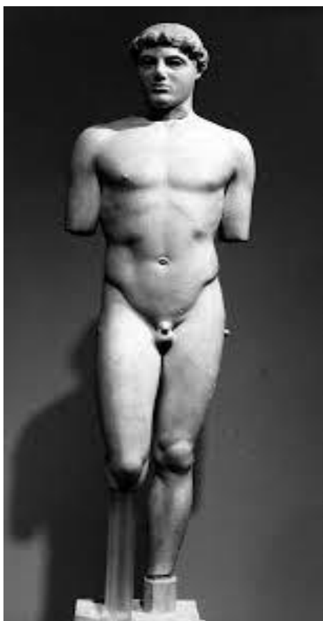
Imagem 01: "Kritios Boy" século V a.C