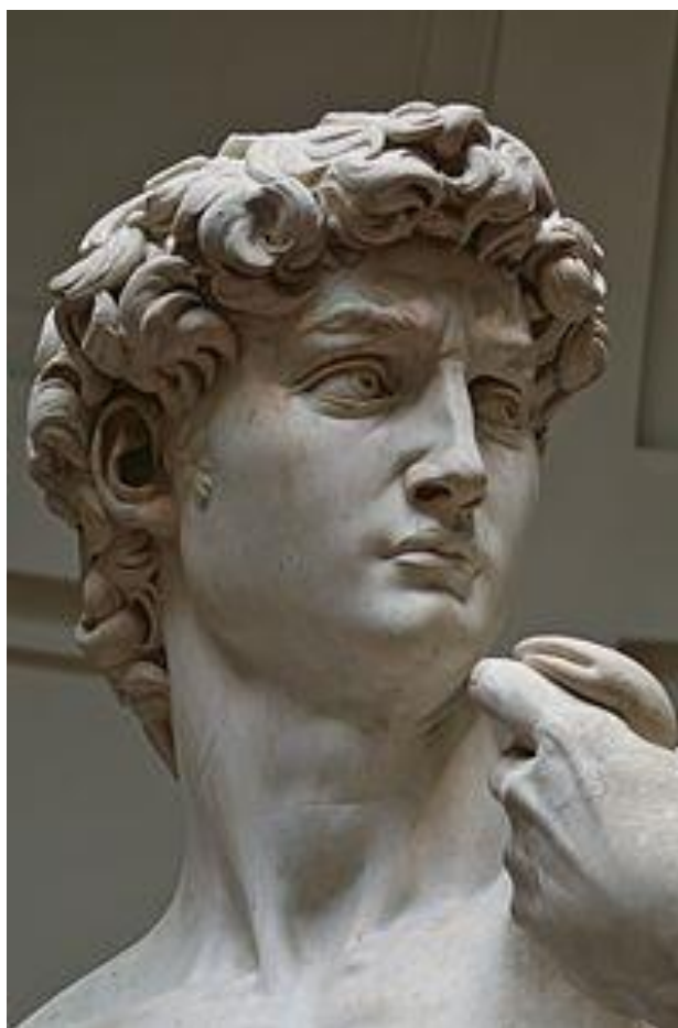
Imagem 04: Olhar de David