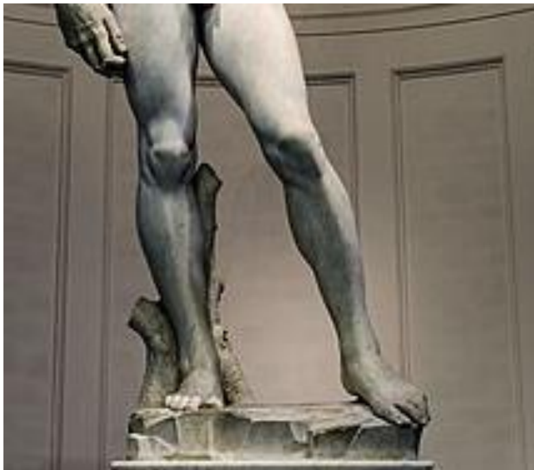
Imagem 05: Contrapposto