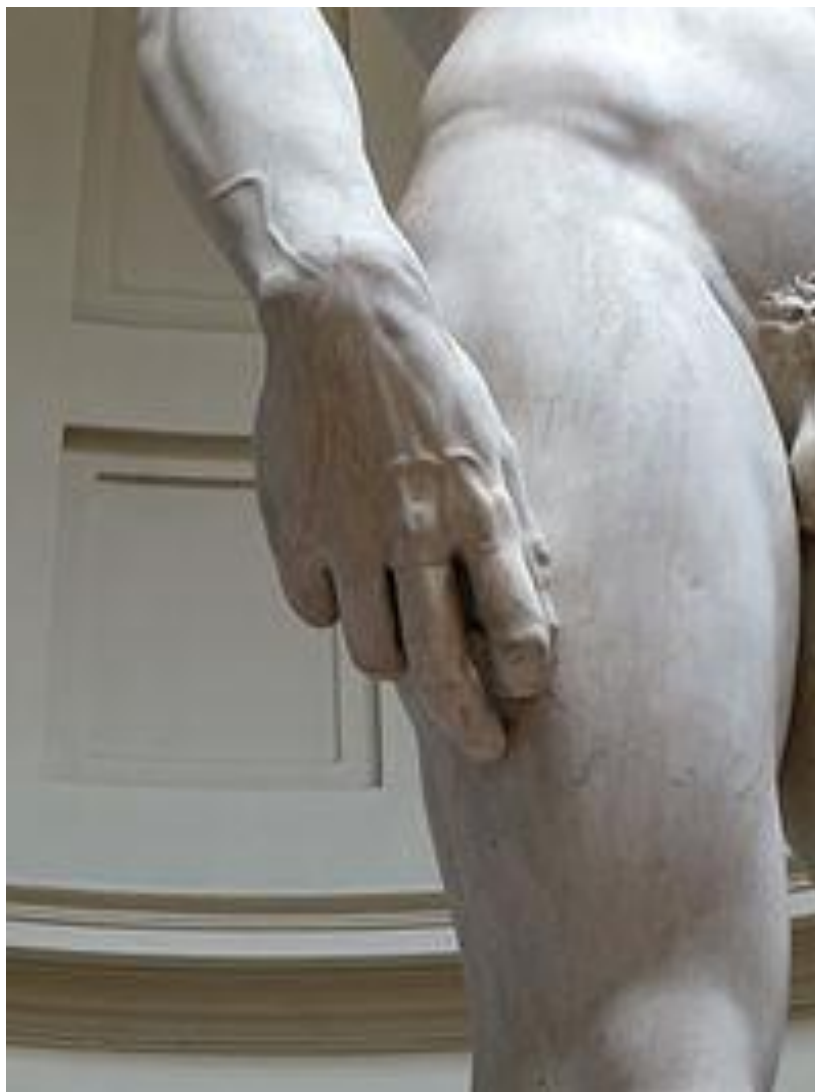
Imagem 03: veias no braço