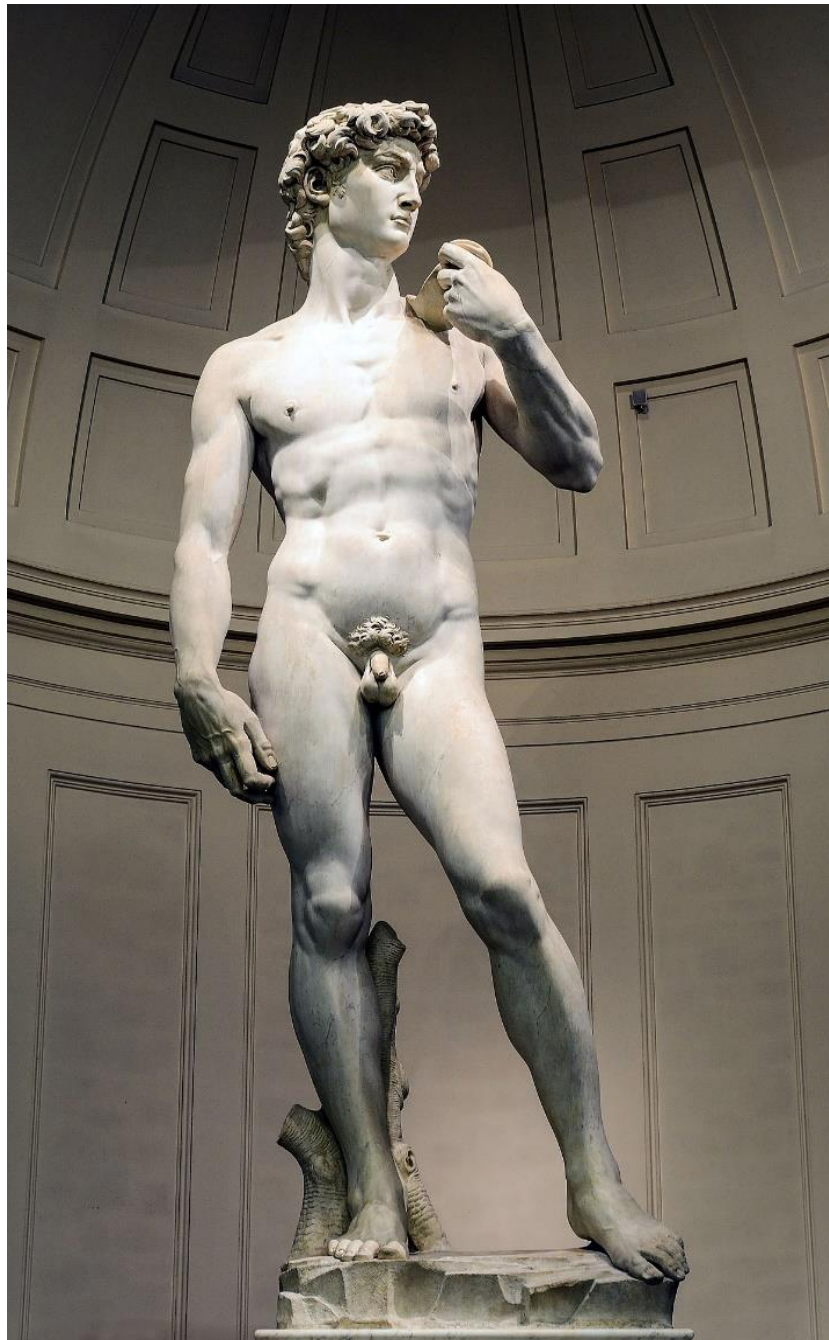
Imagem 02: David' (1501 - 1504), de Michelangelo

Fonte: Wikipédia, a enciclopédia livre (wikipedia.org)