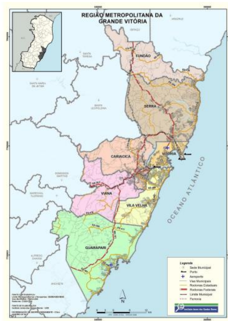
FIGURA 1 – Região Metropolitana Da Grande Vitória.