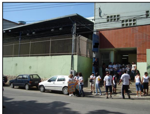
Figura 2 – vista lateral da escola

Apesar das melhorias contínuas realizadas após esse período, a comunidade escolar entende que a configuração atual não é suficiente para garantir as condições mais adequadas de ensino e aprendizagem; por isso, tem lutado, em outros espaços, como o Orçamento Participativo (OP), pela ampliação da Escola Mirante ou construção de um novo imóvel para a escola. A reivindicação já foi listada como prioridade no OP do bairro, mas está enfrentando outros complicadores, como a desapropriação de casas vizinhas.