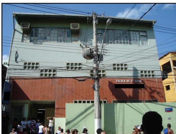
Figura 1 – vista externa da escola

Pelos registros, nota-se quanto essa reforma foi esperada pela comunidade escolar: ela representava o “ sonho ” daqueles praticantes . Havia, inclusive, certa incredulidade ante a conquista: “ Quase não acreditávamos ”. Ao que nos consta, a escola funcionou, durante todo esse tempo, sem uma biblioteca, com restrição de salas de aula e dependências administrativas. A reforma aguardada durante anos foi realizada no início de uma mudança de gestão na prefeitura de Vitória.