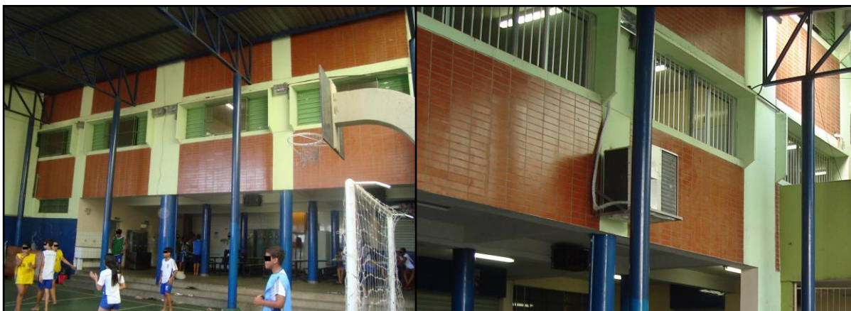
Figura 3 – Vista da quadra. Ao fundo, o refeitório. As janelas pertencem às salas de aula.

me refugiei durante o período em que estive em campo. Na sala dos professores, pude conhecer melhor os profissionais e com eles conversar. Ao lado da sala dos professores, situa-se a sala da direção, com uma área bastante compacta, devido às limitações de espaço citadas.