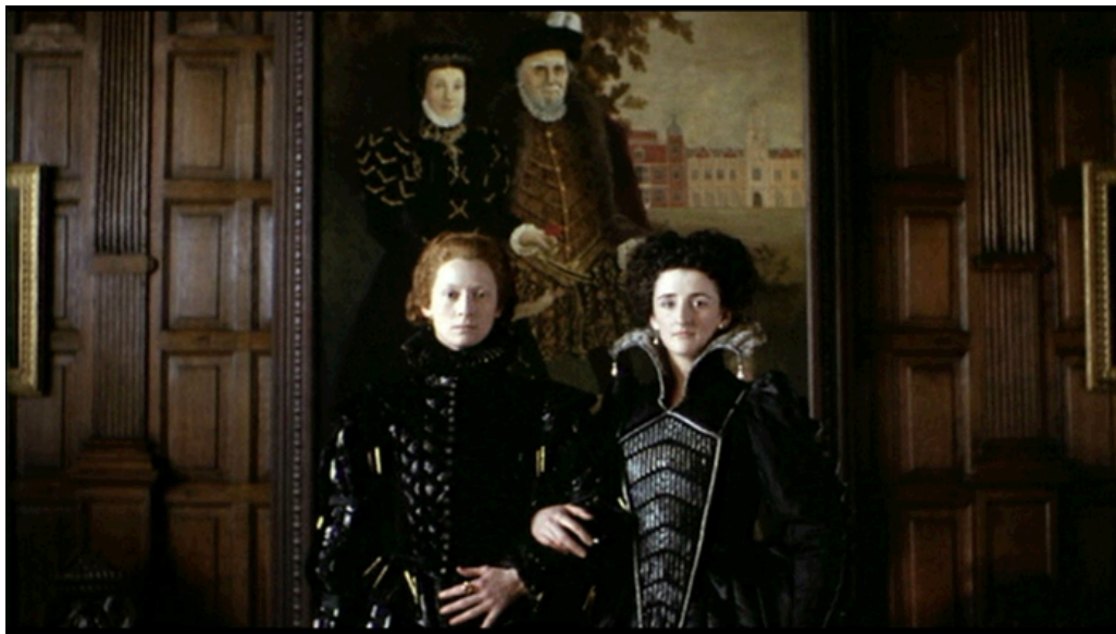
Androginia da personagem de Virginia Woolf, em Orlando (1928). Imagens do filme homônimo (1992). A personagem que dá nome à obra, atravessa mais de três séculos fazendo a transição do masculino ao feminino.