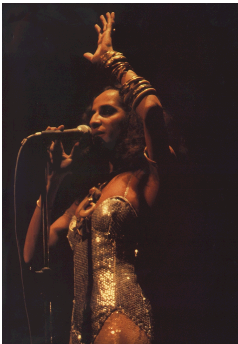
Maria Bethânia dando close, em 1980.

Lançar-se no mundo nos diz mais das montagens, de uma performatividade, de usos do próprio corpo, circulando entre outros corpos e compondo, dessa aparência, suas relações de forças, seus pontos de apego e seus riscos, tudo uma questão de sair do seu armário e cada um deve ter o seu, porque não é de dentro de intimidade nenhuma que um corpo pode se viver e se narrar.