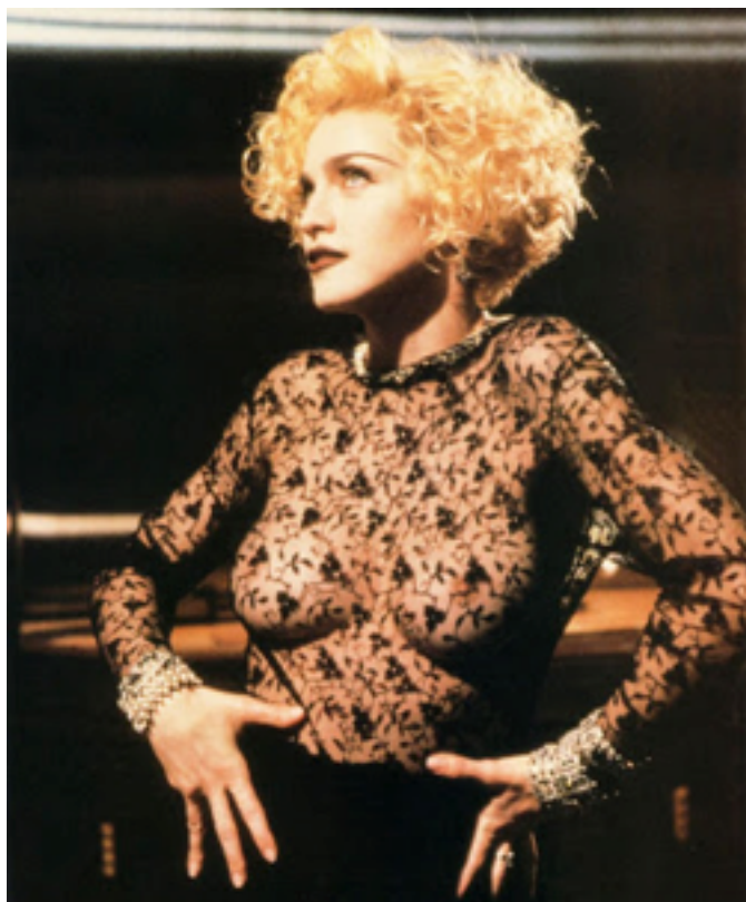
Cena de Vogue (videoclipe oficial).

Madonna bate o leque, levanta as saias e inscreve na Grande História da Cultura Ocidental a batalha de vogue feita nas boates obscuras das gays, das drags e das dikes (sapatonas) americanas dos anos 80. E mesmo no fetichismo de Erotica , a posição de dominatrix não é de um sensualismo convencional. Não é para agradar homens, mas para fazer do corpo seu próprio objeto e instrumento de prazer. Mas essas últimas conversas são de outros tempos e espaços que não se atualizaram naquela ocasião.