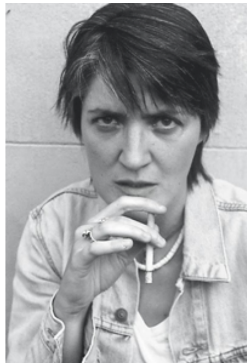
Paul Beatriz Preciado. Imagem disponível em: http://paroledequeer.blogspot.com.br/2014_11_01_archive.html

O dispositivo da contrassexualidade tensiona as bordas de um sujeito universal do regime de verdade que se fundamenta nesses dualismos pressupostos, sendo o mais fundamental deles a cisão entre natureza/cultura, ou corpo/mente. Desse modo, cada um desses pares de polarização binária, acarreta a reprodução do modelo dialético senhor/escravo, no qual a categoria dominante será sempre a de um polo ativo – masculino, emissor, mental ou cultural, sendo esses os pólos concernentes ao campo da razão. Por conseguinte, não nos restringimos à categoria do gênero, como superfície de uma transição. Toda essa cadeia de significações vem de arrasto, sendo necessário o deslocamento da própria cisão binária e não de cada polo dos pares, o que ainda remeteria ao seu oposto.