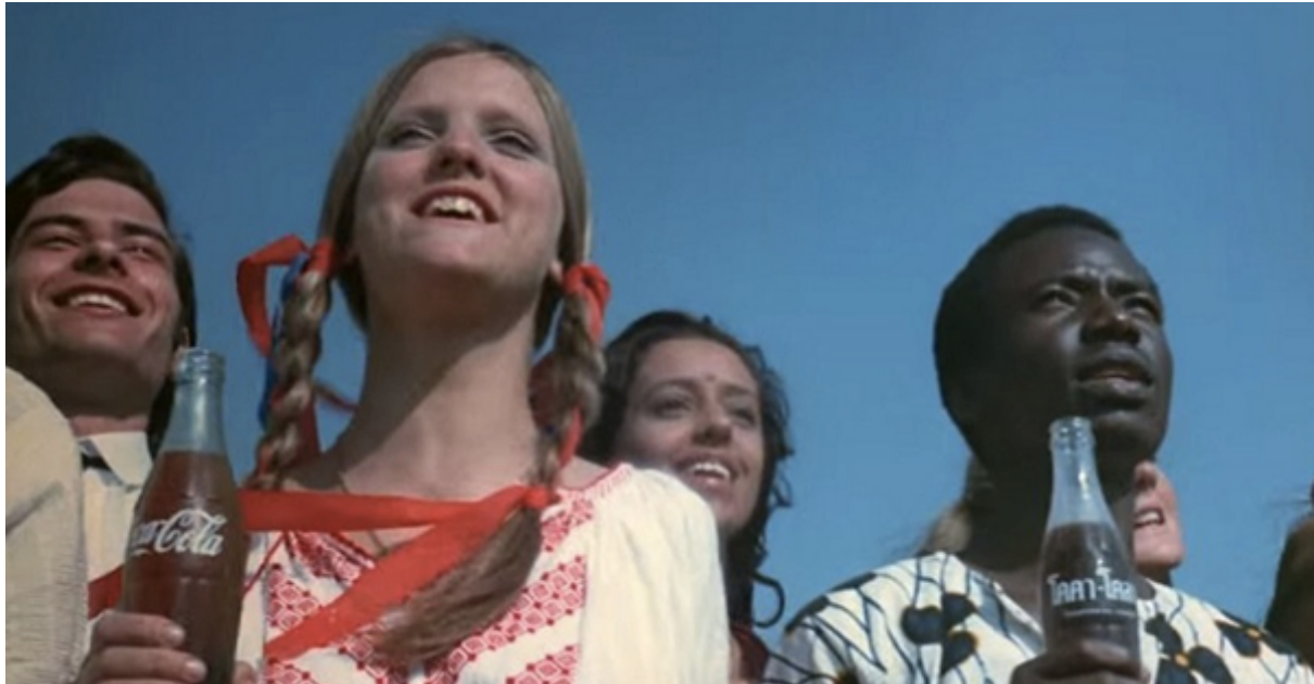
“Hilltop”, anúncio de Coca Cola (1971).

lutas cotidianas, e nisso podemos discordar, mas ainda assim encontrar pontos de aliança, sem que para isso precisemos ser condescendentes com tudo aquilo que situamos em posições de desfavorecimento. “Falar com” não é uma propaganda da Coca-Cola, em que todos os povos aparecem reunidos em harmonia perfeita 35 .