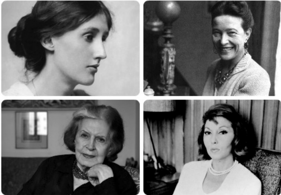
Escritoras feministas. Mulheres escritoras. Escritas femininas.

fazer levantamentos de plataforma lattes . Trata-se de buscar o “fazer funcionar”, ainda que pelo desvio, pela sabotage das máquinas, tomando parte nesse aparato produtivo ao mesmo tempo que desnordeando suas finalidades ou objetos, como bons perversos que somos, desde a psicanálise freudiana 16 .