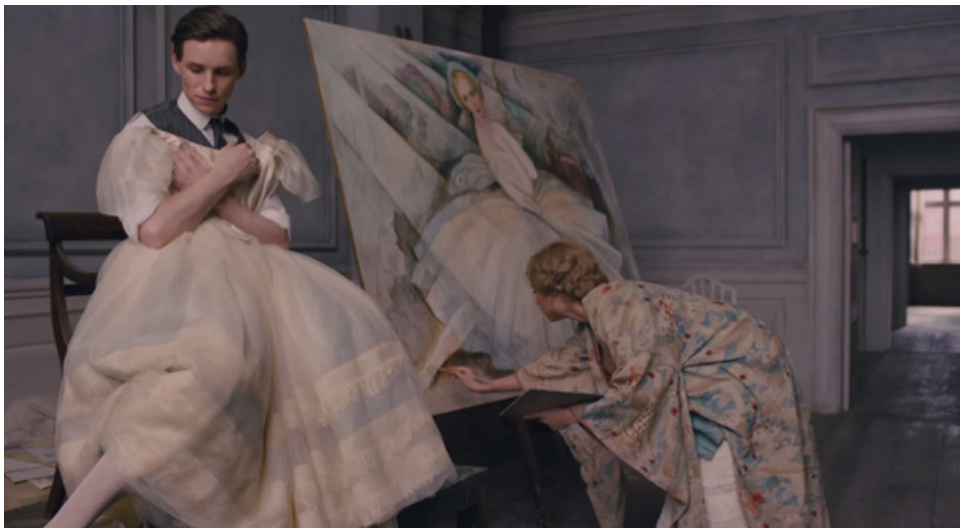
Cena de A Garota Dinamarquesa (2015).

Mais frutífero será discutirmos como essa distinção entre o que se aprende nos livros e o que se aprende “na vida”, feita nos primeiros minutos do vídeo, produz esse ponto de vista que, de tão fechado, fica quase cego, espantosamente insensível às nuances da própria perspectiva. Assim ocorre quando ela faz a ressalva de que esse feminismo “avança” em relação ao liberal, já que não se inserem os homens nesse movimento, de modo que partilharia da concepção radical de que o machismo é um sistema em que homens oprimem e