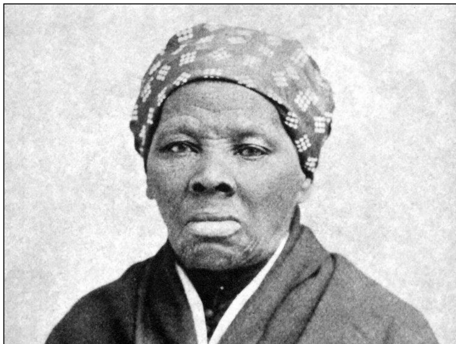
Fig. 6 – Harriet Tubman