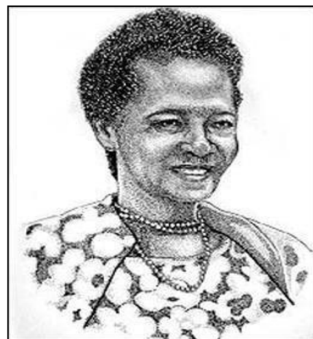
Fig. 5 – Luíza Mahin