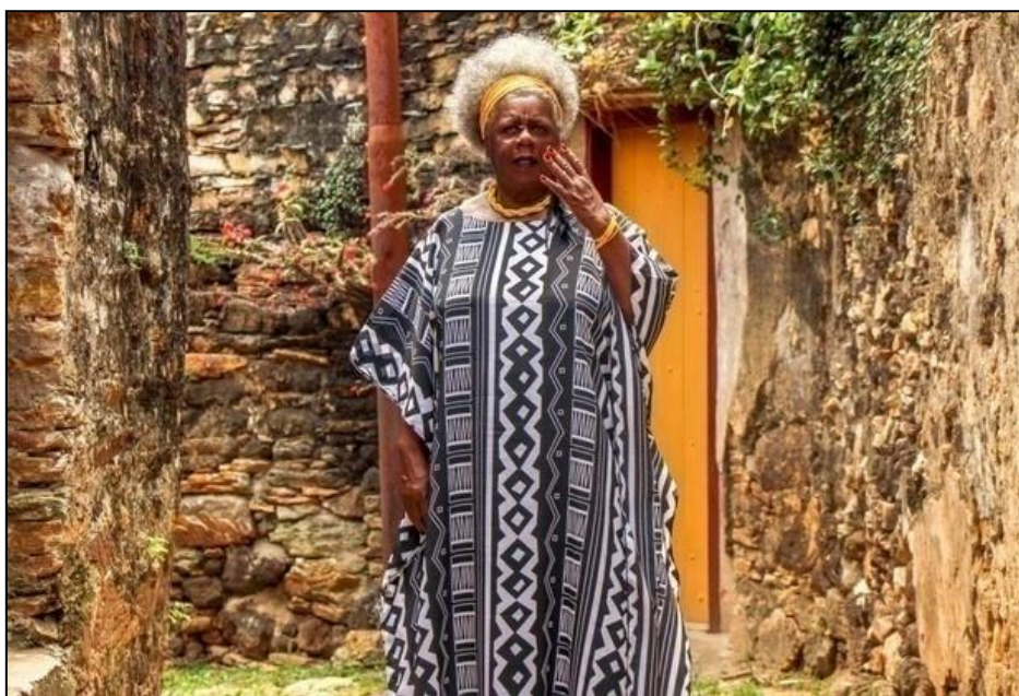
Fig. 7 – Conceição Evaristo