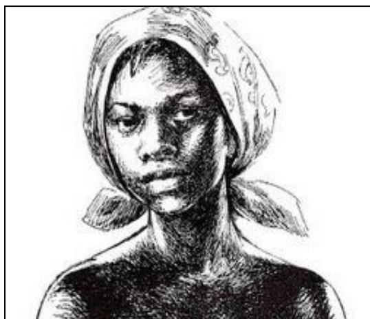
Fig. 4 – Dandara dos Palmares