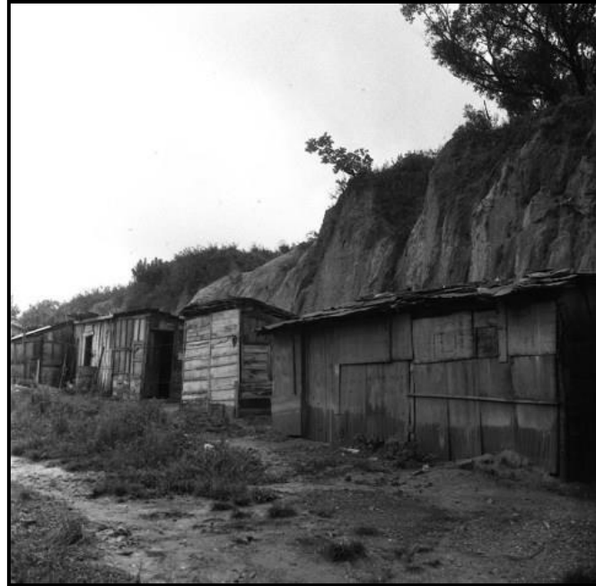
Fig. 8: Pindura Saia (1950-1970)

As desigualdades sociais entre as habitações planejadas e as não planejadas podem ser analisadas também por meio das imagens de como era o morro do Pindura Saia entre os anos 50 e 70: