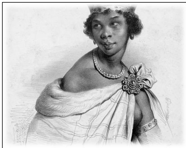
Fig. 2 - Njinga a Mbande

Além de mencionar as biografias de algumas dessas mulheres – da rainha Nzinga à Conceição – é importante também conhecer seus rostos, fixá-los em nossas memórias, divulgá-los às gerações vigentes e seguintes. Nzinga, Dandara e Mahin não apresentam registros fotográficos, portanto registramos aqui representações de suas faces.