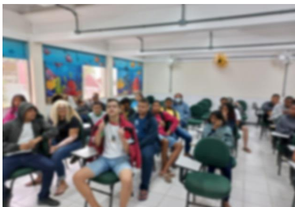
Foto: Encontro sobre democracia.

A dinâmica das bolas de soprar foi um instrumento utilizado para demonstrar que a união do grupo é fundamental e que sem ela o grupo não chega ao consenso. Destacaram, ainda, que o trabalho em equipe deve ser a base de uma boa liderança além de saber ouvir. Os alunos perceberam na dinâmica que o grupo não conseguiu manter as bolas no alto porque cada um só pensou em si mesmo. A avaliação foi positiva para essa etapa, pois a turma se manteve atenta e interessada, com a participação dos colegas na dinâmica.