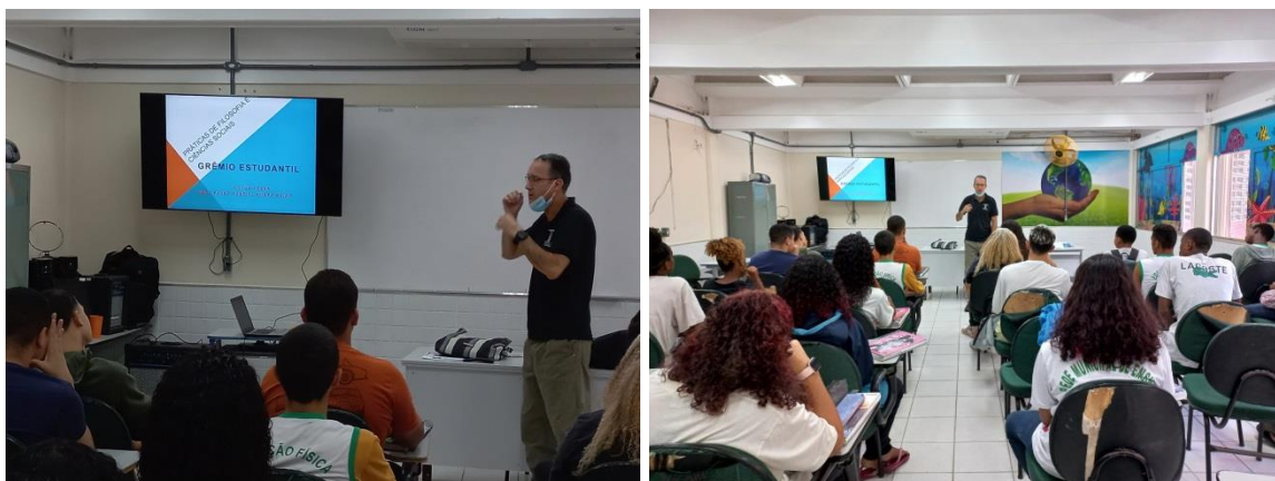
Fotos: Encontro de formação sobre Grêmio Estudantil.

Ao final do encontro, os alunos concordaram que o Grêmio Estudantil é um importante espaço de aprendizado e crescimento democrático para os estudantes, é a sua entidade de representação e que precisam reorganizá-lo na escola novamente.