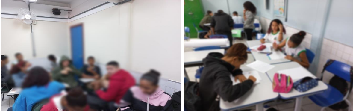
Foto: Leitura e debate do texto filosófico.

6º encontro: Atividade prática: Elaboração de cartazes sobre o Grêmio Estudantil. A Visão dos alunos sobre o Grêmio Estudantil na escola. Qual a função do grêmio? Por que devo me envolver com o Grêmio Estudantil?