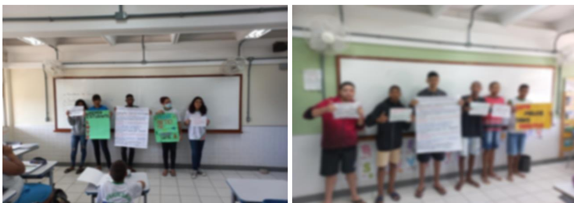
Fotos da apresentação nas turmas sobre o Grêmio Estudantil e convite para participar da entidade estudantil.

Todos os grupos apresentaram as propostas de sala em sala, mesmo aqueles mais tímidos, responderam as dúvidas dos alunos. Durante as apresentações, houve uma maior interação das turmas em conhecer o que é o grêmio, queriam saber onde aconteciam as reuniões e como fazer parte da diretoria. Era perceptível o interesse da escola sobre o tema.